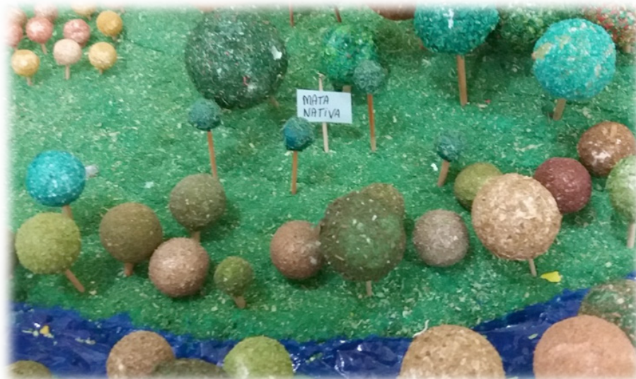
Fotografia 3 –Detalhe das Zonas 4 e 5

A Fotografia 3 expõe de forma detalhada as Zonas 4 e 5 (rio, mata nativa e animais silvestres):