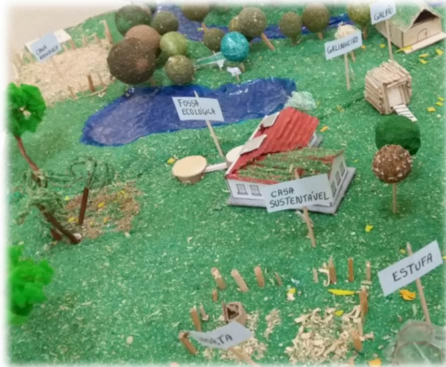
Fotografia 2 –Detalhe das Zonas 0, 1, 2 e 3