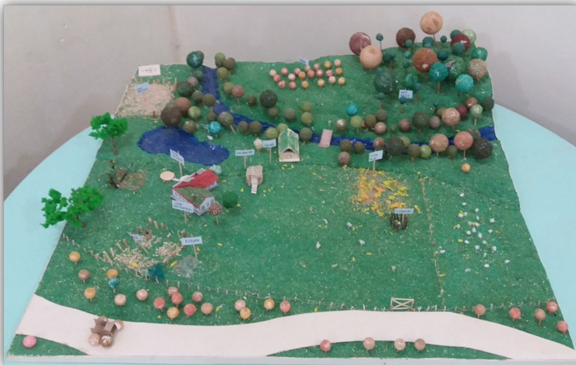
Fotografia 1 - Maquete propriedade rural sustentável

A maquete buscou refletir as irregularidades do terreno, a fim de demonstrar de forma mais próxima da realidade os aspectos da propriedade rural sustentável, além de elencar elementos e culturas comuns às propriedades da região da escola. Além disso, destaca-se que, na Zona 0, a localização da casa foi planejada de modo a aproveitar a luz proveniente do período da manhã, sendo que a casa sustentável contou com telhado verde para melhor aproveitamento e retenção do calor, bem como uma cisterna para reaproveitamento da água da chuva. Ainda buscou-se mostrar a preservação da mata nativa na Zona 4 e a preservação das matas ciliares no rio e na estrada. A Fotografia 1, abaixo, apresenta a maquete elaborada: