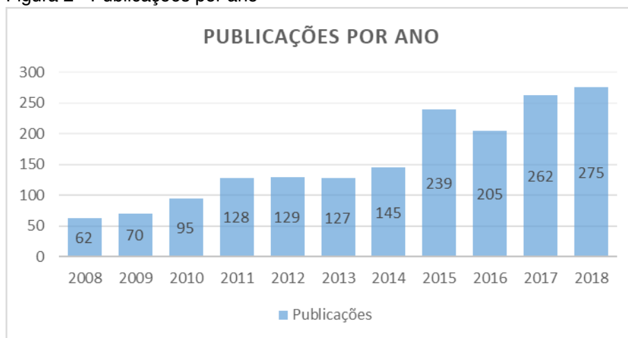
Figura 2 - Publicações por ano

Observando o histórico temporal das publicações envolvendo o termo clima ético (Figura 2), constata-se um aumento gradativo destas na última década, intensificando-se nos últimos 5 anos. A evolução de pesquisas nessa área pode ser justificada por Yemer, Yalditan e Ergun (2012) pela maior conscientização da sociedade frente às questões éticas, pois o clima ético influencia a organização, por meio da sua força de trabalho, além de ser considerada uma vantagem competitiva. Ou seja, um diferencial para a sobrevivência de uma organização frente ao mercado competitivo.