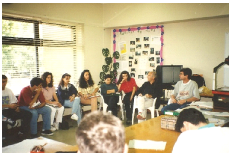
Figura 2 - Seminário de Apresentação dos Trabalhos

Legenda: 22 a 24 de maio de 1995.