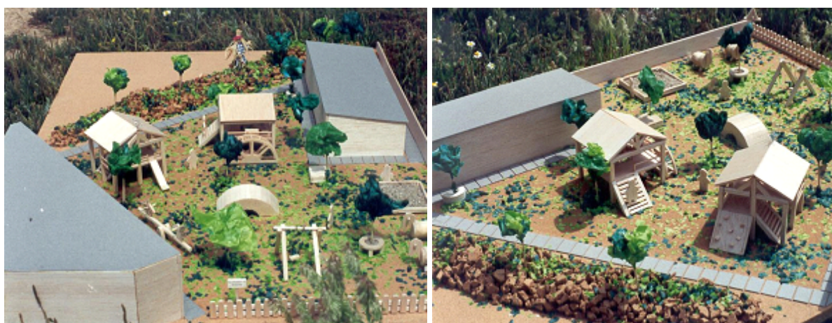
Figuras 19 e 20 - Maquetes das alterações dos recreios escolares