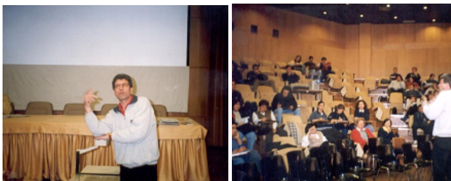
Figuras 29 e 30 - Professor Doutor Reiner Hildebrandt proferindo a Conferência “Campos de Experiência e de Aprendizagem”

Legenda: maio de 2001.