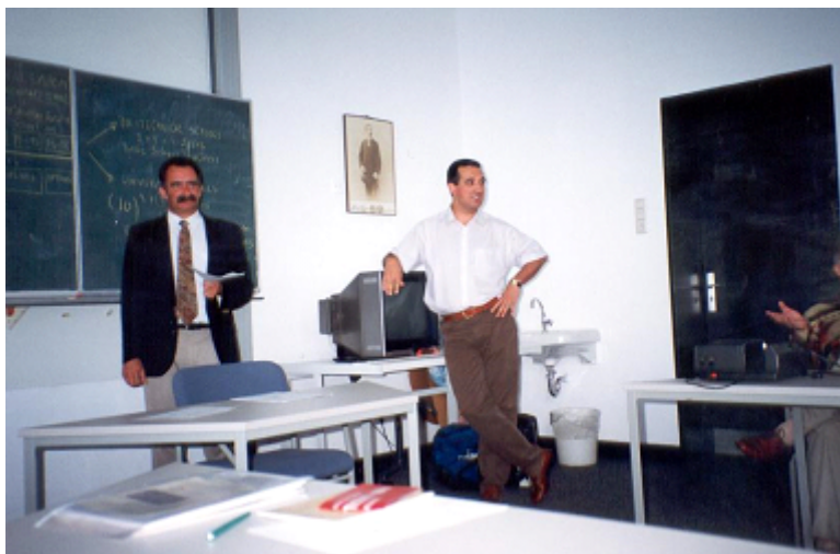
Figura 4 - Seminário na Universität Essen