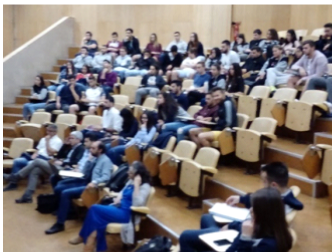
Figura 53 - Plateia de assistentes no II Simpósio Internacional: Modelos de Formação em Educação Física e Desporto

Legenda: maio de 2019.