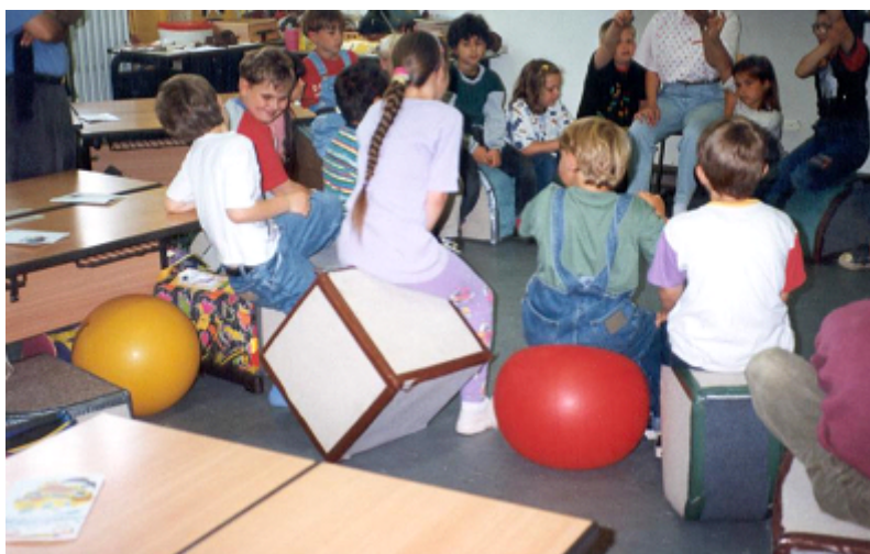
Figura 3 - Visita a uma escola primário em Gelsenkirchen

Durante a permanência em Essen foi proporcionada uma visita a uma escola primária, situada em Gelsenkirchen, onde os professores portugueses tiveram oportunidade de assistir a uma classe móvel (resultante da utilização de equipamento escolar alternativo, produzido nas oficinas da Fachbereich Sport).