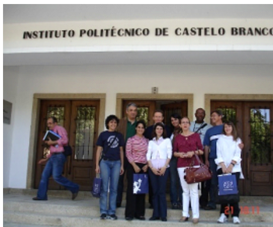
Figura 46 - Os Participantes no I Simpósio Internacional: Motricidade Infantil – O Corpo no Quotidiano, em visita às instalações do IPCB

Legenda: maio de 2010.