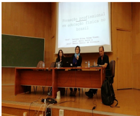
Figura 50 - Os Participantes brasileiros no II Simpósio Internacional: Modelos de Formação em Educação Física e Desporto