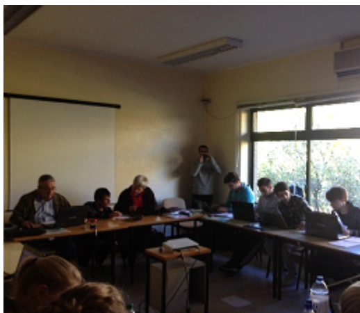
Figura 45 - Sessão do Curso “Métodos de Investigação Qualitativa” 3.ª edição