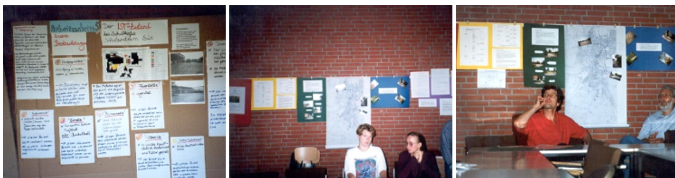
Figuras 5, 6 e 7 - Seminário de apresentação de trabalhos dos estudantes na Hochschule Vechta

Em 7 de julho, os professores portugueses já em Vechta, participaram no Seminário de apresentação de trabalhos dos estudantes na Hochschule Vechta.