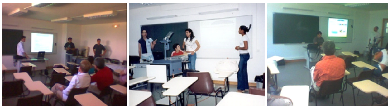
Figura 42 - Conferencistas no Seminário “O Corpo na Sociedade Contemporânea”