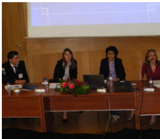
Figura 48 - Os Participantes brasileiros no I Simpósio Internacional: Motricidade Infantil – O Corpo no Quotidiano