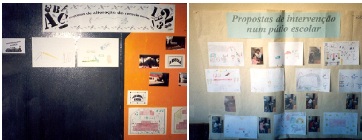
Figuras 17 e 18 - Esquemas das alterações dos recreios escolares.