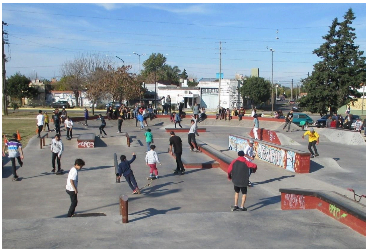
Figura 1 – Comotricidad simultánea en el Skatepark de Berisso

Motriz (1999, 2001), una nueva subcategoría dentro de las prácticas psicomotrices: la comotricidad 9 . Esta es entendida como “campo y naturaleza de las situaciones motrices que ponen en copresencia a varios individuos que actúan, quienes en consecuencia pueden verse e influirse mutuamente, aunque sin que la realización de sus acciones respectivas necesite o suscite entre ellos interacciones motrices instrumentales” (Parlebas, 2001, p. 73).