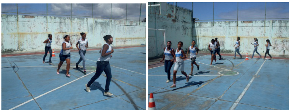
Foto 10 e 11: Os alunos correm com um esforço subjetivo da carga auto planejado após a primeira experiência.

Os alunos devem correr novamente 6 minutos com uma percepção subjetiva de esforço como média na escala subjetiva de esforço. Eles devem contar os números de cones em que cada aluno está correndo passando.