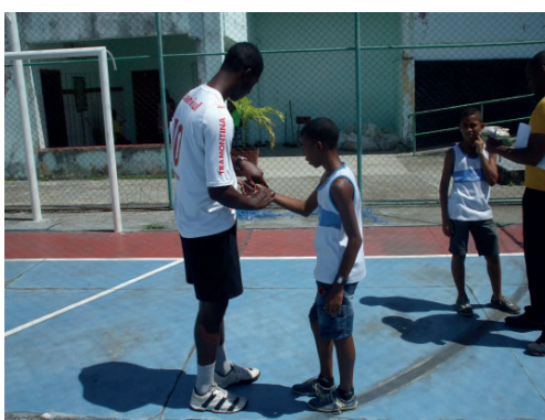
Foto 9: Os alunos aprendem medir os batimentos cardíacos em um minuto apalpando o pulso durante 15 segundos e multiplicando por quatro.