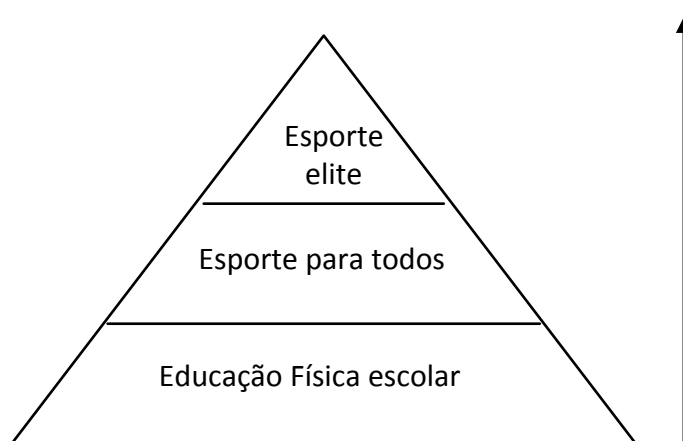
Figura 1 – Proposição e desenvolvimento da manifestação esportiva: visão idealista

Fonte: López (1989 apud OLIVA, 1995, p. 32)