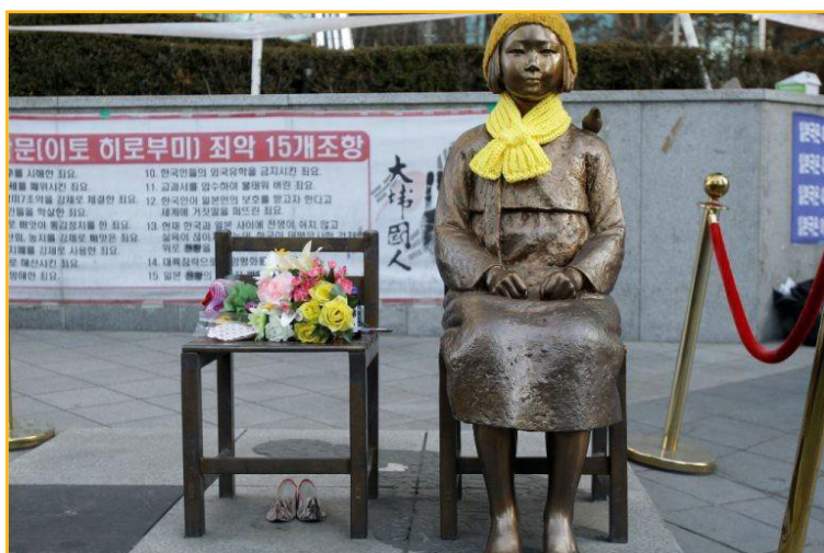
Figura 2 – Estátua em homenagem as “mulheres de conforto”

buscam pressionar o governo japonês a admitir oficialmente seu envolvimento na administração dos “bordéis de guerra”. No dia 14 de dezembro de 2011, além das exposições tradicionais de faixas, cartazes e fotos, o Korean Council ergueu uma estátua de bronze em homenagem, tanto às mulheres que perderam suas vidas durante este período, quanto aquelas que continuam lutando e clamando por reconhecimento.