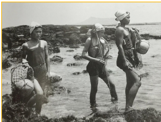
Figura 1 – Mulheres haenyeo