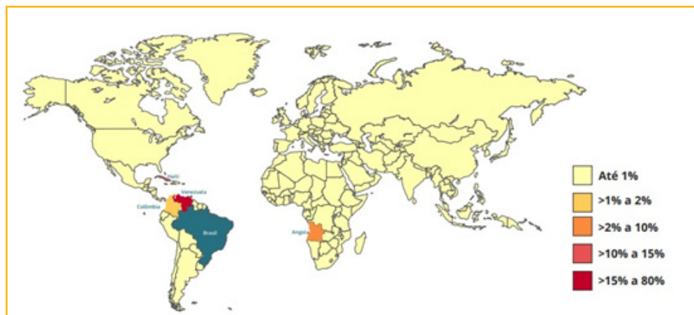
Figura 1 – Distribuição relativa dos solicitantes de reconhecimento da condição de refugiado, segundo país de nacionalidade ou residência habitual