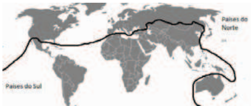
Figura 1: Mapa da divisão Norte-Sul.

O primeiro diz respeito à divisão Norte-Sul da qual o termo parte. A clássica separação a partir de uma linha sinuosa em que os países desenvolvidos se localizam ao norte (mais a Austrália ao sul) e os subdesenvolvidos ao sul do mapa mundial (conforme Figura 1) provoca contestações a respeito dessa classificação que enquadra os segundos em uma condição de dependência em relação aos primeiros. Tais contestações são propugnadas especialmente com relação à dificuldade de classificação de países que atualmente apresentam padrões de crescimento econômico consideráveis, tais como a China, o Brasil e a Índia.