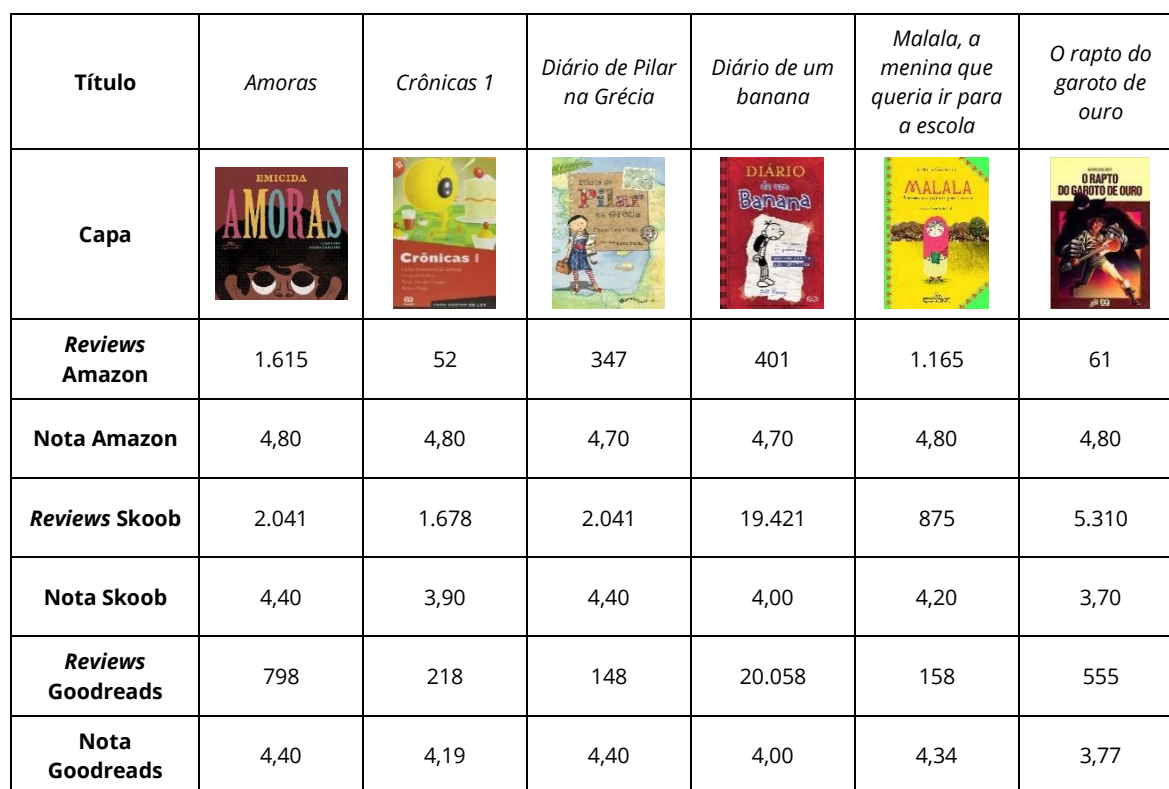
Quadro 3 - Quantidade de reviews e avaliação média dos livros pelos leitores e compradores

Dados coletados em 26 de novembro de 2020.