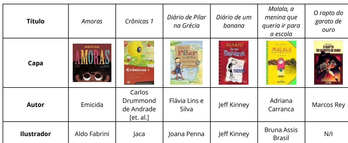
Quadro 4 - Aspectos biblioteconômicos dos livros do corpus

Neste artigo foram considerados aspectos biblioteconômicos todos os itens da primeira coluna do Quadro 4 . A começar pelos dois primeiros, capa e título, tem-se aí dois dos aspectos mais relevantes na escolha de livros em geral e, notadamente, da categoria infantojuvenil.