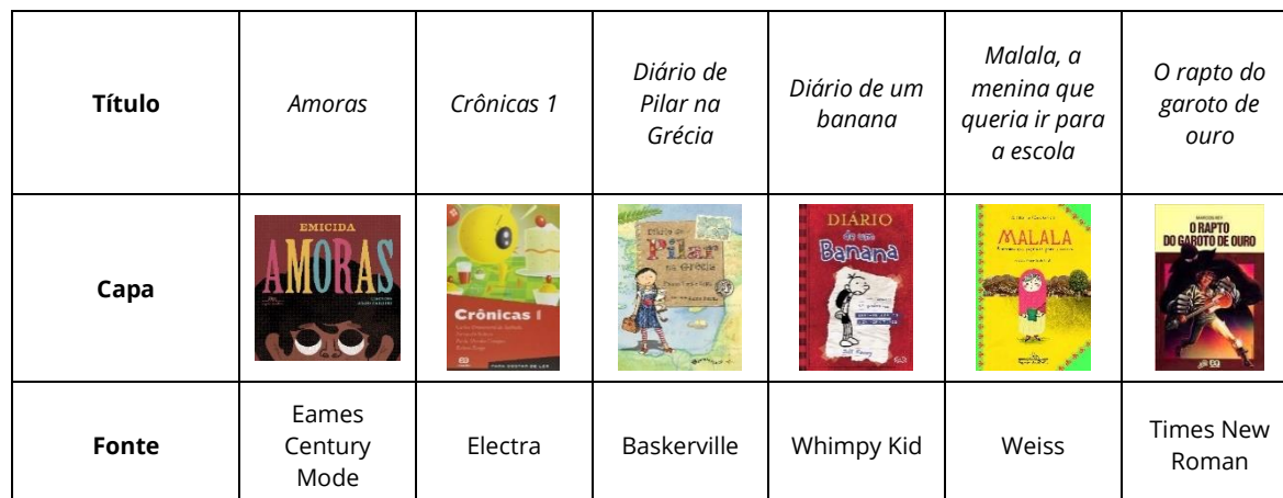
Quadro 5 - Aspectos morfológicos dos livros do corpus

Quanto à forma dos livros analisados, pode-se perceber a predominância de alguns aspectos. As fontes empregadas são relativamente grandes se comparadas às de outros gêneros editoriais, assim como o espaçamento entrelinhas e as margens, que são generosas. O destaque fica para Diário de um banana , que apresenta uma fonte “manuscrita”, a Wimpy Kid. Em seu canal no YouTube, o autor, Jeff Kenney, declara que escrever seus livros usando essa fonte o faz “entrar no clima” e o ajuda na criação dos textos.