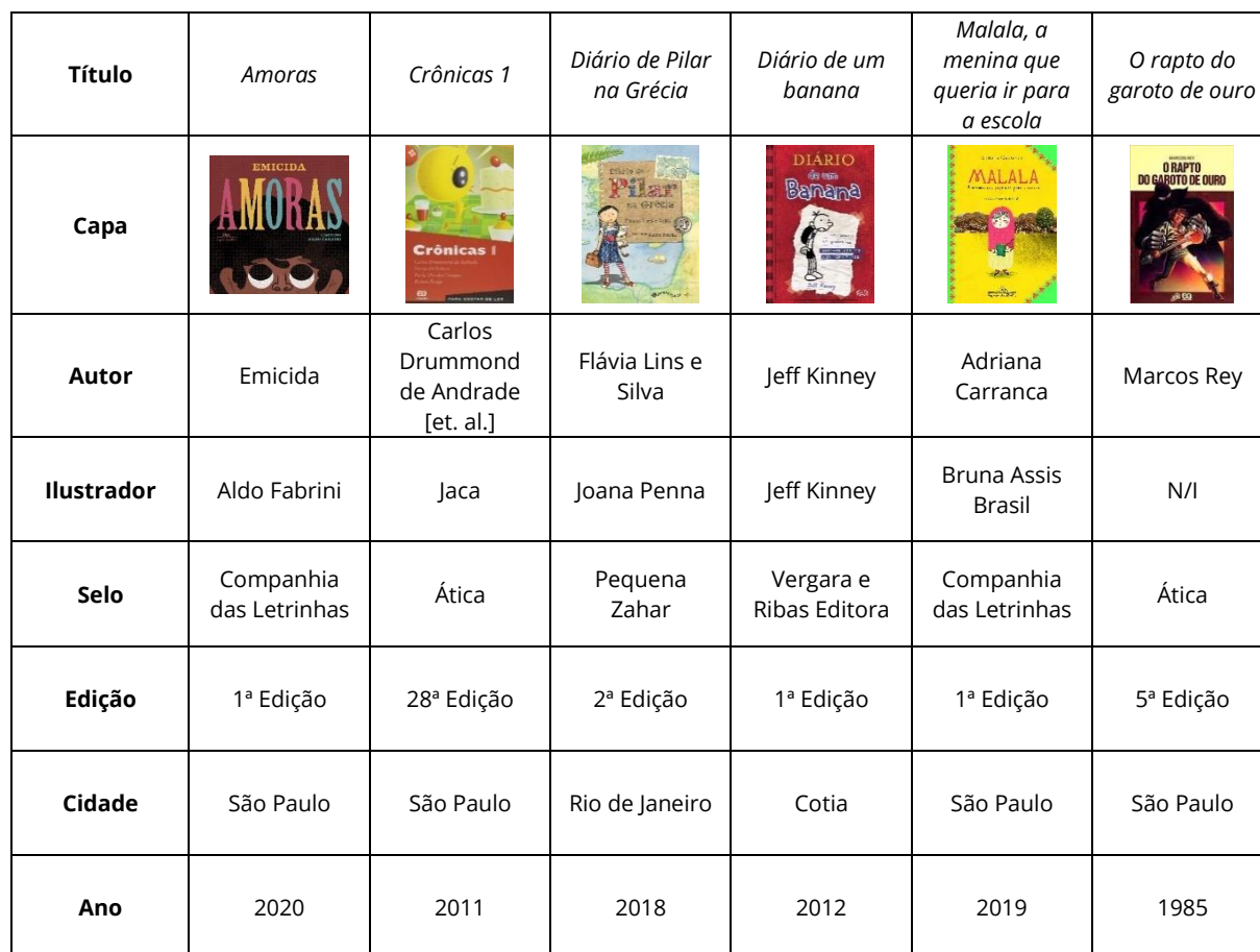
Quadro 2 - Corpus selecionado para análise

que estimulem o aumento da quantidade de leitores e da frequência de leitura desses “meninos”.