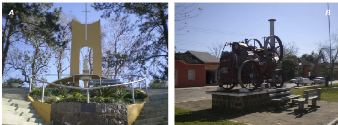
Figura 2 - Monumento a Nossa Senhora Salete e Antiga Máquina a Vapor