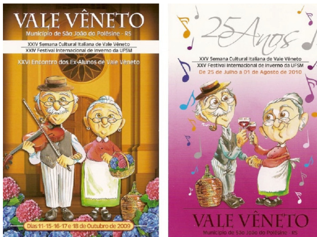
Figura 3 - Folders do Festival de Internacional de Inverno da UFSM e Semana Cultural Italiana de Vale Vêneto

Entre as características mais marcantes das festividades de São João do Polêsine, estão as motivações religiosas, pois a grande maioria delas possui fundo religioso e são organizadas pelas paróquias locais, e as temáticas do mundo rural, visto que, algumas delas são realizadas com o objetivo de agradecimento as colheitas. A gastronomia tradicional italiana é outro elemento importante nessas festividades e representa um grande símbolo da cultura local, colocada como um dos grandes atrativos das festividades e de toda a Região da Quarta Colônia.