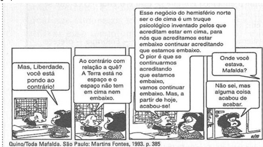
Figura 1- Nesta seqüência a personagem questiona e discute as questões ideológicas e as convenções geográficas. Essa foi uma das diversas tiras que utilizamos em nossas aulas e para facilitar a leitura e a análise dessa tira busca-se desenvolver uma relação entre cartografia e geopolítica.

Além disso, se pensarmos na relação entre cartografia e geopolítica, o que dizer então do ensino das projeções cartográficas dos livros didáticos? Por que limitamos no ensino a resumir as leituras de mundo nos mapas de Mercator e de Peters? Como seria ensinar as leituras de mundo a partir do olhar de cá (Brasil), ou seja, o olhar geopolítico de Golbery do Couto e Silva, no qual o Brasil aparece no centro “geométrico” do mundo? Concebendo as projeções também como uma visão geopolítica do mundo, dominado por certos interesses e estratégias, encontramos muitos elementos de análise nas tiras e histórias em quadrinhos, em especial a “Mafalda”, criada pelo quadrinista argentino Quino. Mafalda é uma menina que vive a questionar o mundo e que tem os sentidos muito aguçados sobre aquilo que não vê sentido. Em muitas de suas histórias, põe-se a questionar as divisões geográficas do mundo. Nestes questionamentos, revela as intenções ocultas na cartografia e que demonstram a articulação entre os mapas e a geopolítica.