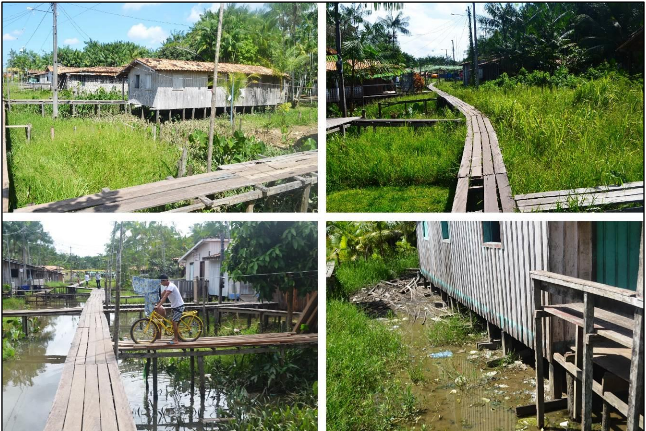
Figura 4 – Fotografias de pontes, inundações e aterro das ruas do bairro Carnapijó