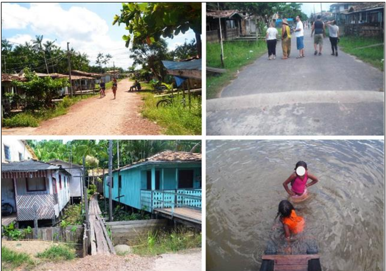
Figura 3 – Fotografias da situação de algumas ruas do bairro Carnapijó