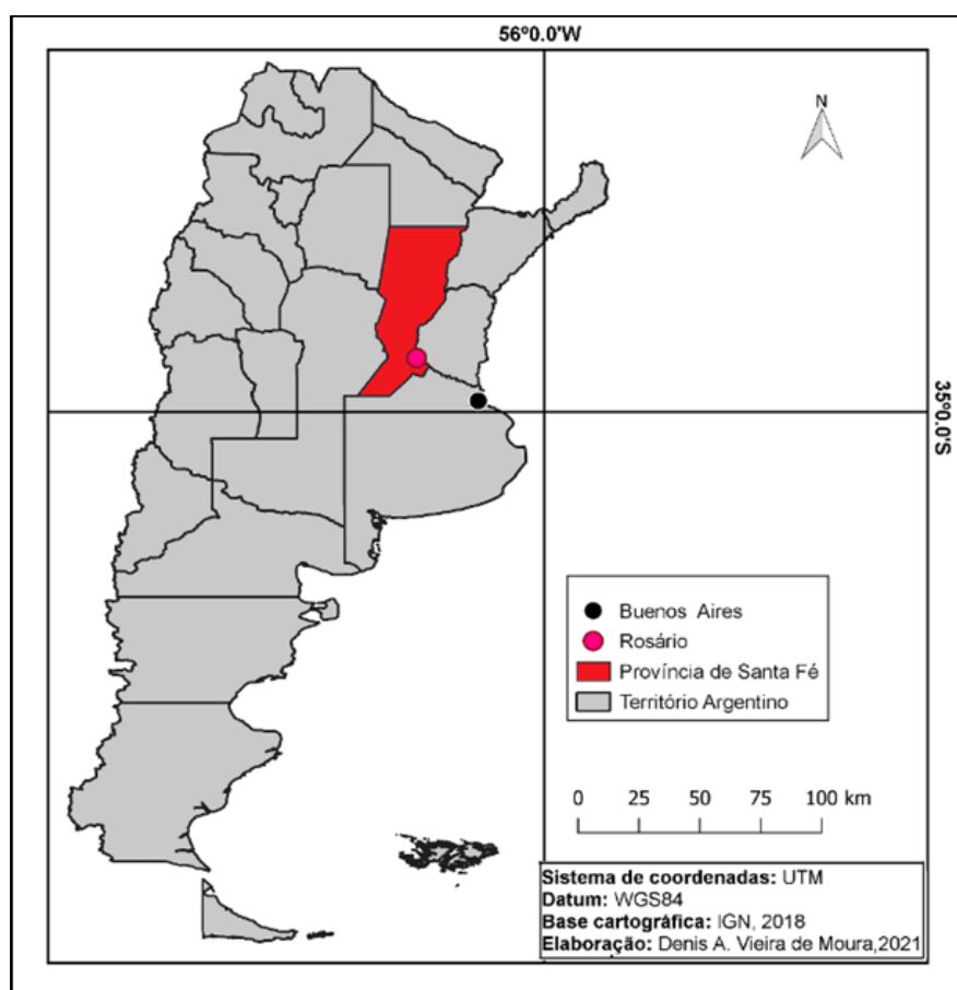
Figura 1 - Localização de Rosário

No que tange à metodologia utilizada, este trabalho foi construído a partir da leitura de referencial bibliográfico referente à temática e entrevistas com imigrantes para compreender, a partir de suas experiências, as dinâmicas que envolvem a emigração e imigração. Para isso, realizou-se entre 19 e 21 fevereiro de 2020 um trabalho de campo e entrevistas 1 com 12 imigrantes oriundos de diferentes partes do Brasil (figura 2). O contato inicial com os entrevistados se deu por meio de um grupo no Facebook chamado "Fala Rosário", composto por aproximadamente 20.000 pessoas, algumas das quais já haviam passado por essa experiência e outras que estão se preparando para estudar na Argentina, nos próximos anos.