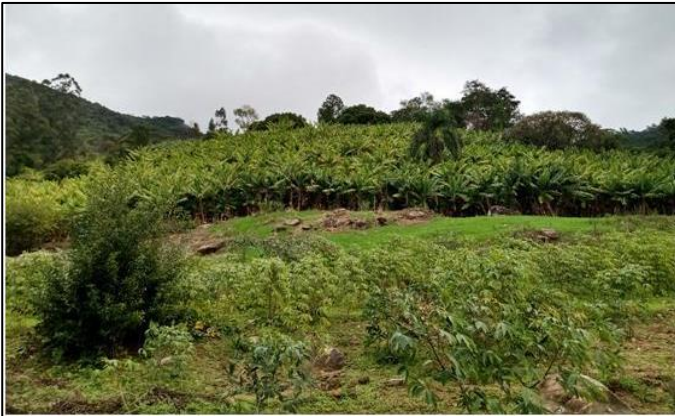
Figura 2 – Área de cultivo de bananas