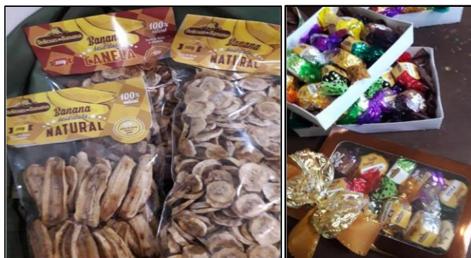
Figura 3 – Produtos da agroindústria