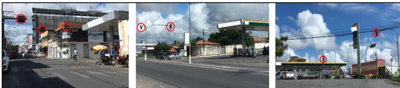
Figura 2 - Semáforos em cruzamentos de vias nas proximidades de um PRCs