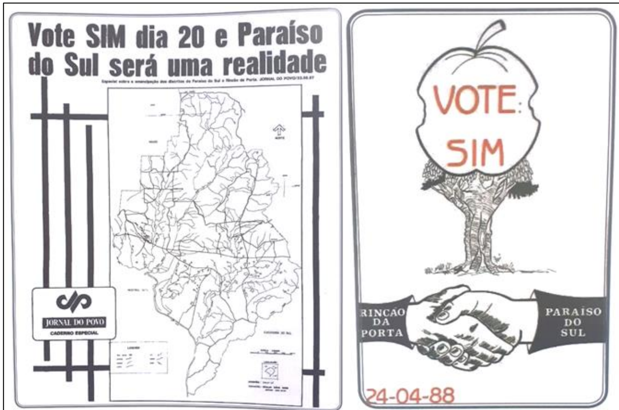
Figura 4 – Mapa da área de emancipação e panfleto do plebiscito