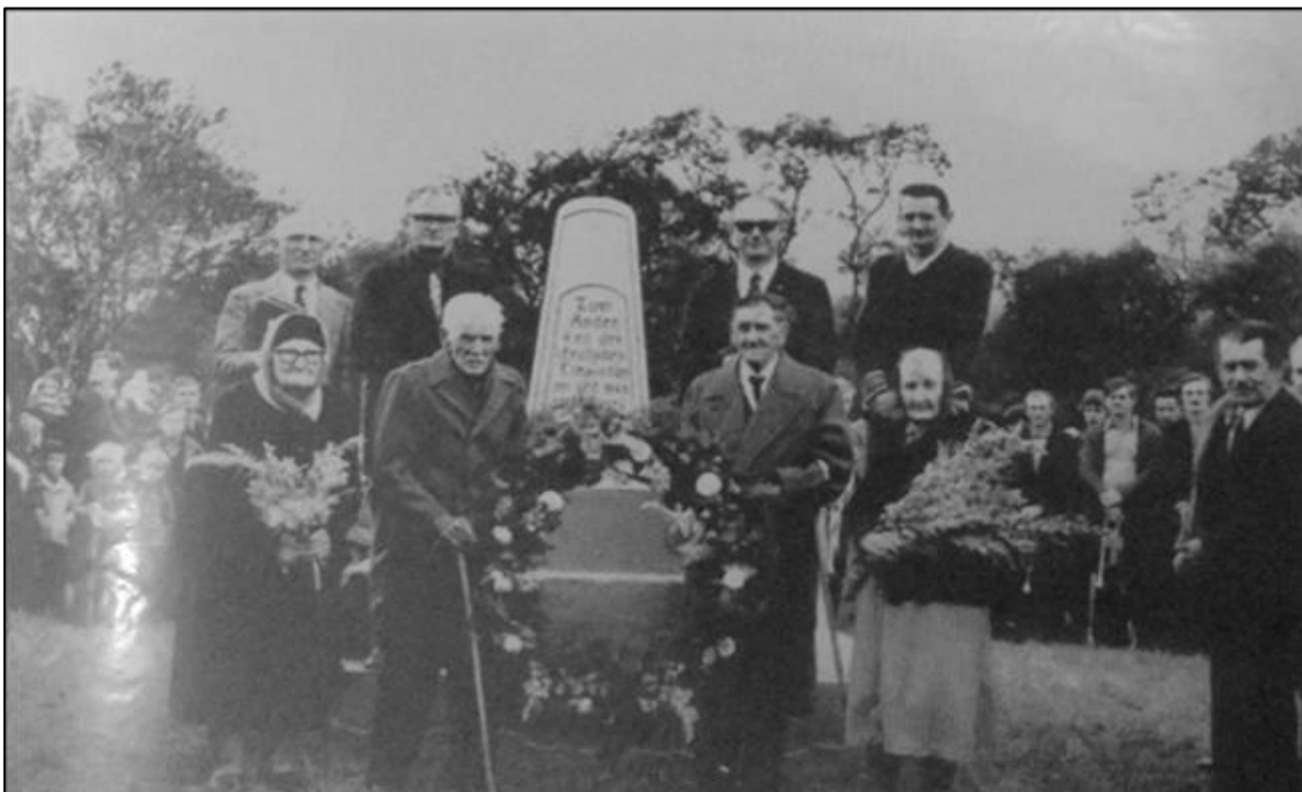
Figura 2 – Monumento ao Imigrante alemão em Paraíso do Sul/RS