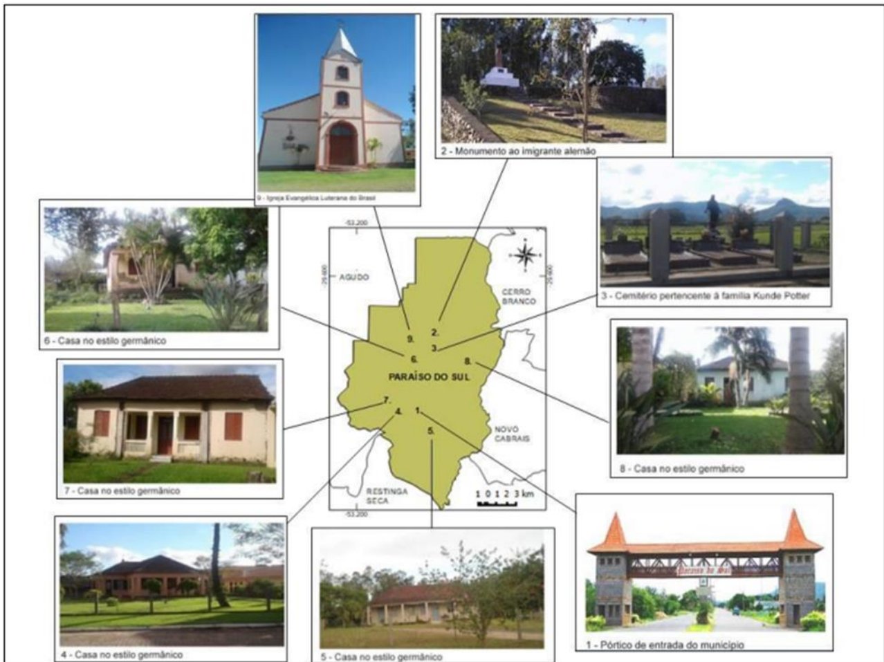
Figura 6 – Localização dos principais códigos de Paraíso do Sul/RS