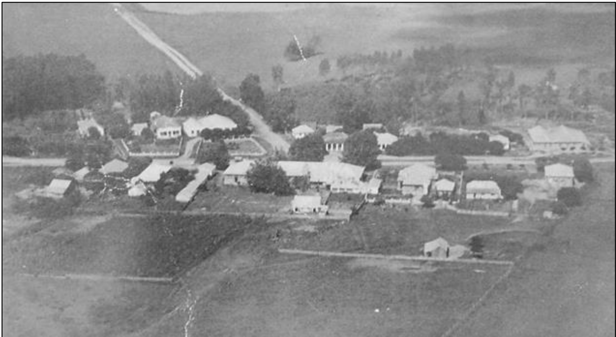
Figura 3 – Distrito de Rincão da Porta