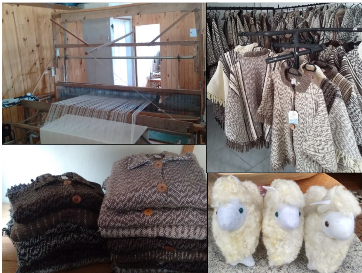
Figura 2 - Tear, palas e chaveiros confeccionados e comercializados na Vila Progresso