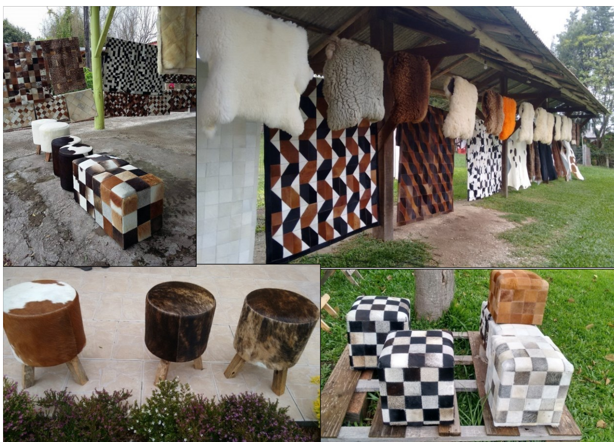
Figura 4 - produtos em couro e lã de ovelha, comercializados na Vila Progresso.