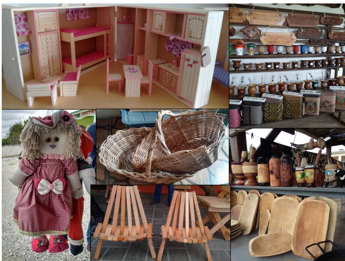
Figura 3 – Diversificação dos produtos comercializados na Vila Progresso