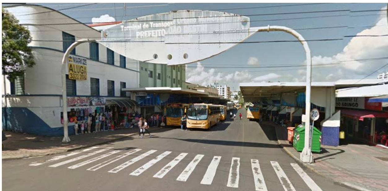
Figura 1: Terminal de ônibus urbano de Chapecó-SC.