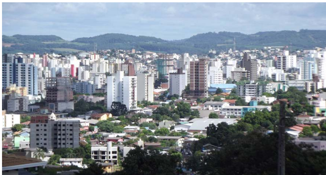
Figura 3: Vista parcial da cidade de Chapecó-SC.