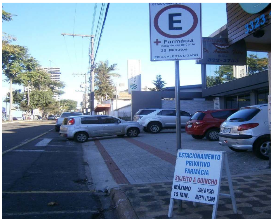
Figura 6: Placas indicando uma forma de poder no espaço público de Chapecó-SC. 19/05/2014.

tendência de fracionar o tempo de uso do espaço (ou seja, tempo máximo de parada para veículos), entendemos que a placa que está mais abaixo na figura 06 expressa nitidamente as relações de poder e de força existente neste local, pois se o cliente da farmácia passar do tempo estipulado na placa, seu carro será guinchado; sendo que este território, em tese, por ser na rua, é público.