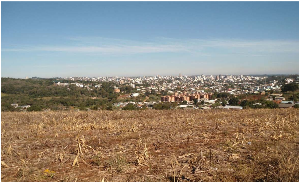
Figura 5: Região em Chapecó-SC. 18/03/2014.