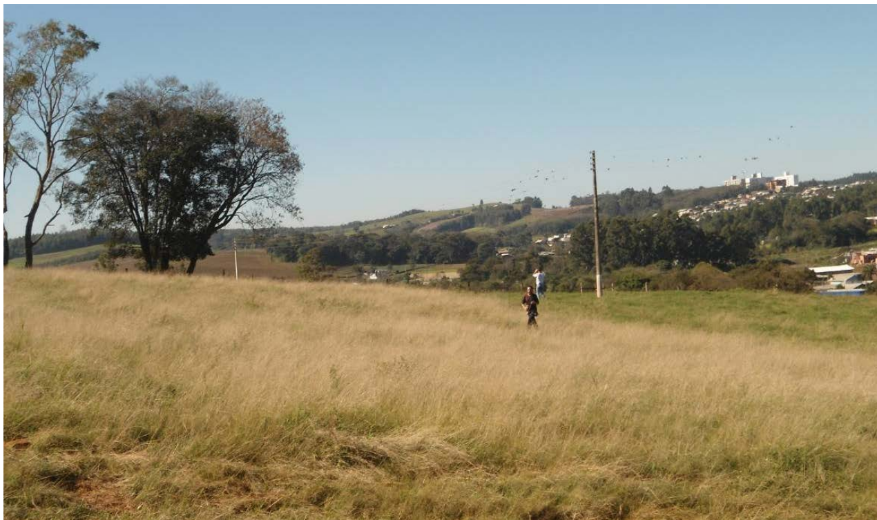
Figura 2: Paisagem em Chapecó-SC.

uma perspectiva didático-pedagógica interessante. Analisar, por exemplo, em que medida a paisagem que aparece ao fundo e na porção do lado direito da figura influencia o ambiente mais natural – a mata – considerado tão importante, sobretudo para a preservação de nascentes e da própria mata. Assim, o professor pode questionar seus alunos sobre como as relações de identidade, do cotidiano e da existência (na perspectiva da categoria de lugar) podem influenciar a modificação da paisagem.