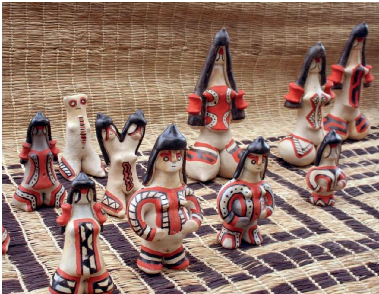
Figura 7: (2018).