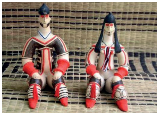
Figura 5: acervo pessoal de Francisco Machado (Chico). (2018).