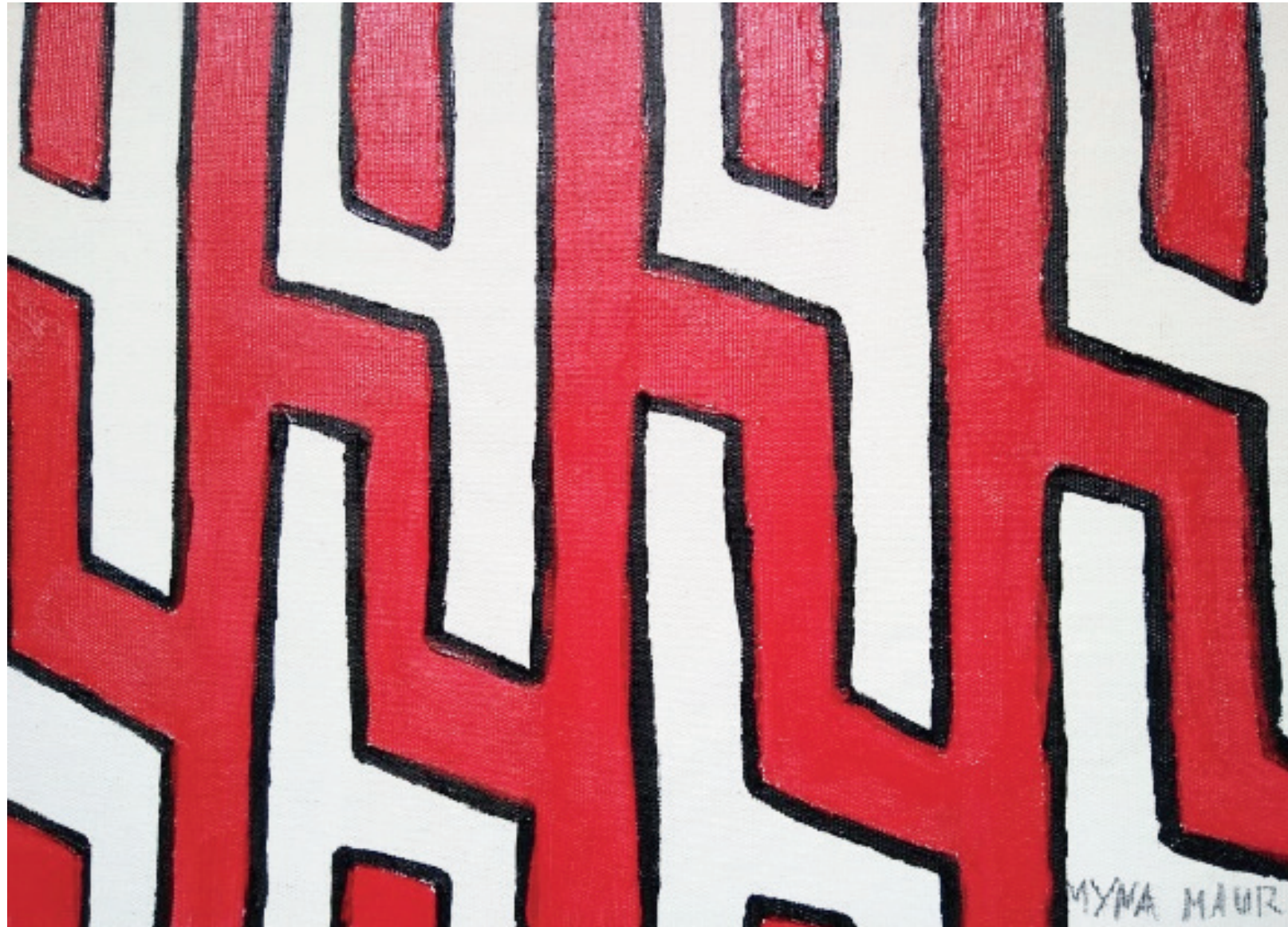
Figura 4: Rarajie : Essa pintura é feita no corpo das moças, quando elas vão dançar Aruanã. Os rapazes também a usam, quando participam da festa do Hetohoky.