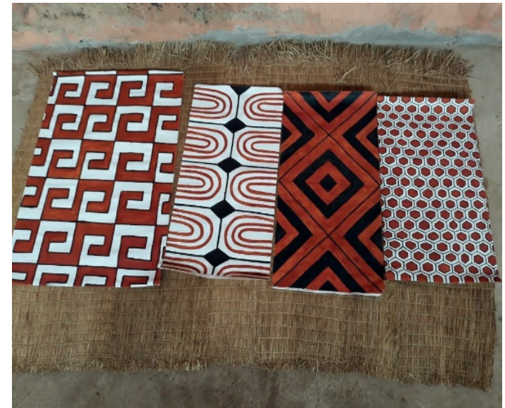
Figura 1: Trabalhos produzidos por mim, Myna Mauri.

A seguir apresento para vocês alguns exemplos de grafismos: