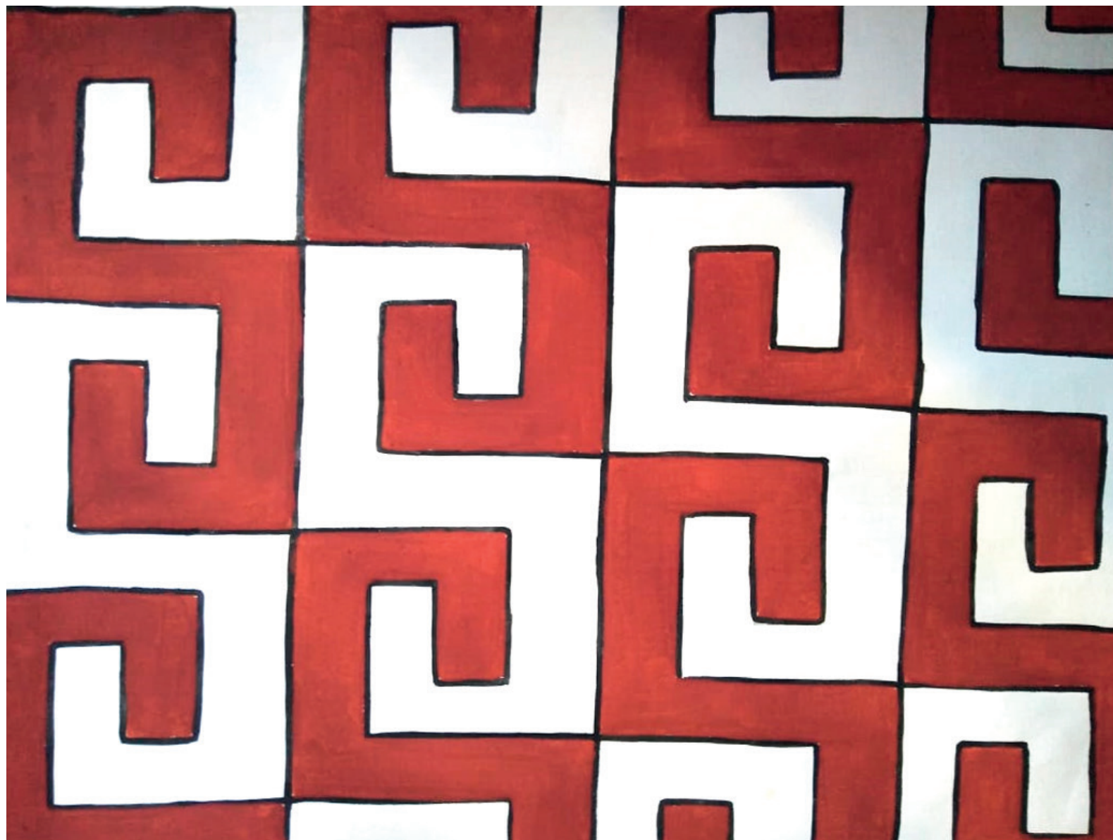
Figura 2: Háwyky kyri : Essa pintura é utilizada por mulheres e homens para pintar o corpo, começa na perna e termina no braço. Também serve para pintar em potes, esteiras e maracás. Os homens também as usam na pintura de remos, balaaios, etc.