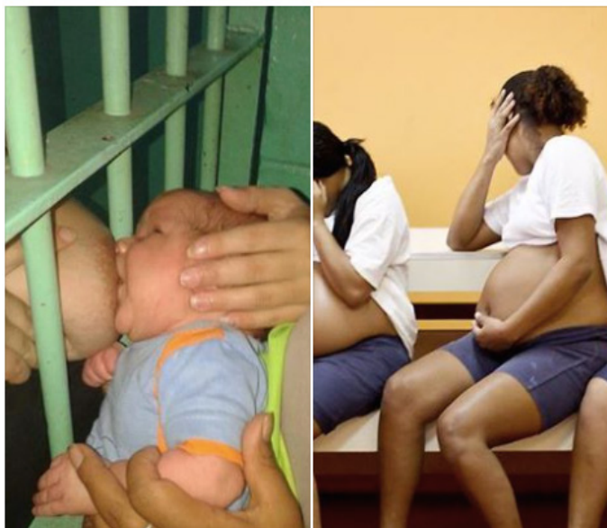
Figura 4: Postagem em “comemoração” ao dia das mães, realizada em 2015.

A outra foto daqui ( http://irenegarciaperulero.com/feminista/ )