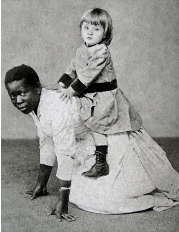
Figura 2: Babá brincando com criança em Petrópolis , clicada em 1899 por Jorge Henrique Papf.