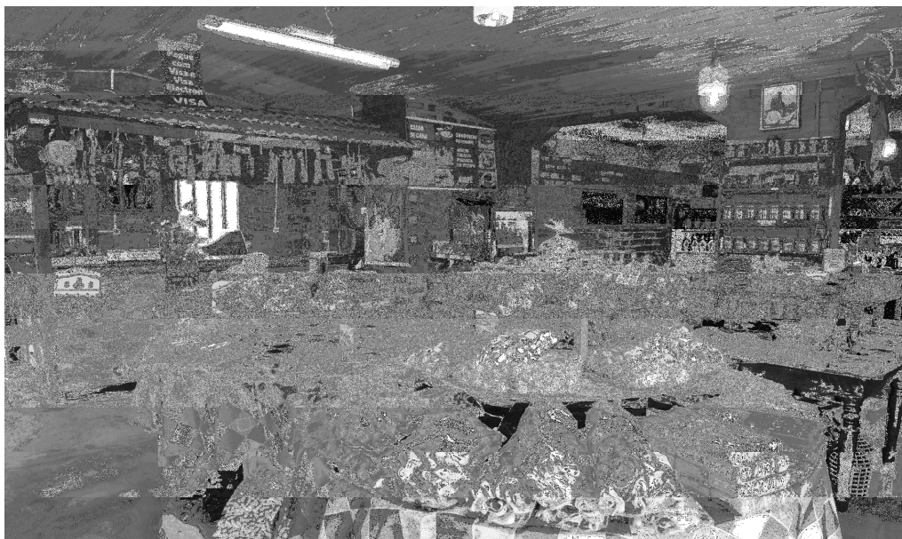
Figura 4 - Cantina da Terra, em Marau; seu acervo de oferta, em sua grande maioria, são produtos da agroindústria familiar local e regional, mas principalmente da Rota das Salamarias.

Para promover a ligação mais efetiva entre a produção e a comercialização, além de feiras e de vendas diretas nas propriedades e/ou encomendas, há um centro de vendas de produtos da referida rota, denominado de Cantina da Terra, logisticamente situado na margem da RS 324, no interior do perímetro urbano de Marau.