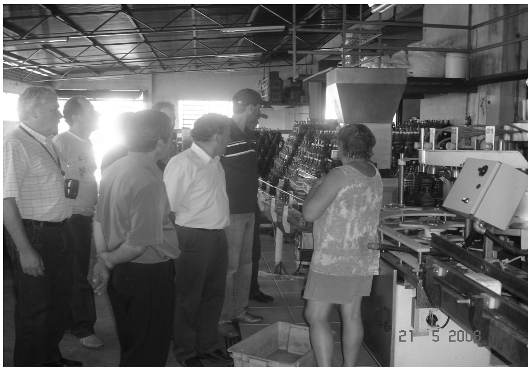
Figura 3 - Visitações de membros da Rota das Salamarias em outras experiências mercantis de agrupamentos de produtores rurais na Região Colonial do RS, processo esse que revela difusão, intercâmbio e produção coletiva de conhecimentos.

Em entrevistas com produtores pudemos perceber que houve e continua a haver parcerias com outros roteiros turísticos e de gastronomia étnica da região, em particular, a rota do Caminhos de Pedras e a do Vale dos Vinhedos, ambas de Bento Gonçalves. A intenção dessa prática é de “trocar idéias e experiências, participar de palestras, capacitar empreendedores”, relata em entrevista um membro da Rota das Salamarias.