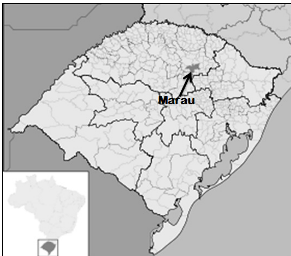
Figura 1 - Localização do município de Marau no estado do Rio Grande do Sul.

grupos no meio rural tendem, de uma forma ou de outra, reproduzir-se com redefinições. Por isso que a manutenção de fatores ligados à tradição do cotidiano da vida do agricultor familiar é um elemento de atração e de otimização no interior da referida rota. Os produtos artesanais (vinho, salame, queijos, em particular), a gastronomia (os restaurantes “típicos”, os “cafés coloniais”), o turismo aquático, a venda e visitação da produção de erva-mate, dentre outros, são os pontos de grande expressão.