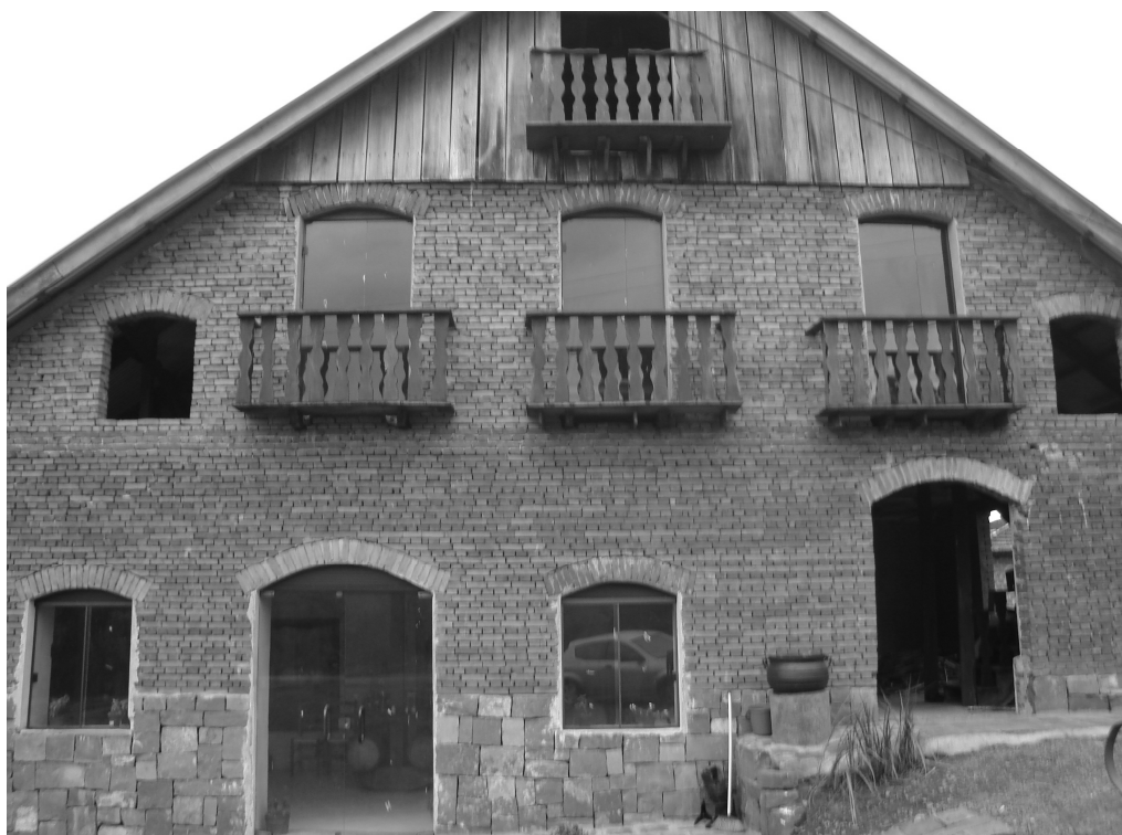
Figura 5 - A parte de frente da cachaçaria e agroindústria de produtos derivados da cana e da uva no interior da Rota das Salamarias; a construção conserva características da habitação antiga da família que, segundo o proprietário, é uma réplica da casa que seu avô possuía “antigamente na Itália”.