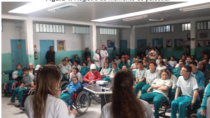
Figura 4: Registro do momento de palestra.

Outro recurso adotado foram as palestras, realizadas uma vez por bimestre, com duração de aproximadamente 30 minutos, sempre em dois turnos (manhã e tarde) a fim de que todos os alunos pudessem participar (Figura 4). Os assuntos abordados eram referentes às principais doenças que ocorrem na cavidade bucal, maneiras de prevenção, tratamento e importância de uma dieta saudável. Essa atividade era realizada com uma linguagem acessível e adequada, além disso era adotado um modelo de diálogo, onde os graduandos buscavam ser provocativos com a plateia, instigando perguntas e interação.