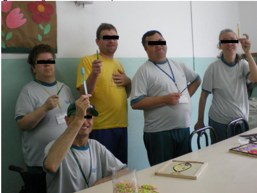
Figura 1: Registro do momento que os alunos receberam escovas dentárias.

Na primeira visita, cada turma foi individualmente visitada para apresentação dos acadêmicos e do projeto que se iniciaria. Todos os alunos ganharam um kit com escova e creme dental, a fim de promover e estimular o autocuidado (Figura 1).