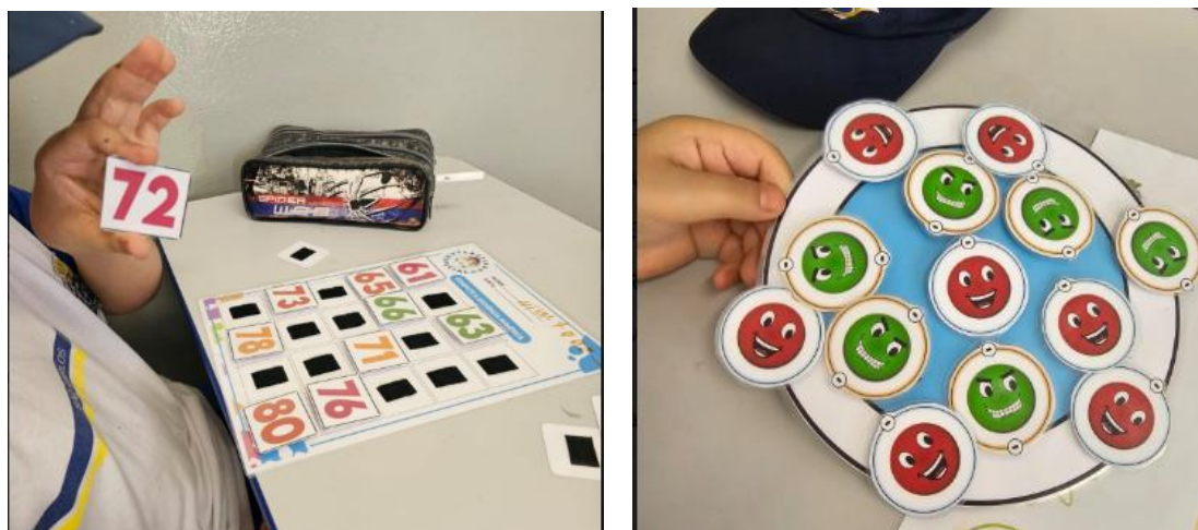
Figura 2 – Material estruturado/adaptado de matemática e ciências

O estudante B relatou que, assim que conheceu a professora do ensino colaborativo (PEESPF), utilizou materiais educativos em sala, como brinquedos de montar/encaixar, quebra-cabeça. É importante relatar que, ao falar “materiais educativos”, o estudante B se refere ao material estruturado elaborado e oferecido pela professora. A figura 2 apresenta exemplos desse material, respectivamente utilizado na aula de matemática e na de ciências.