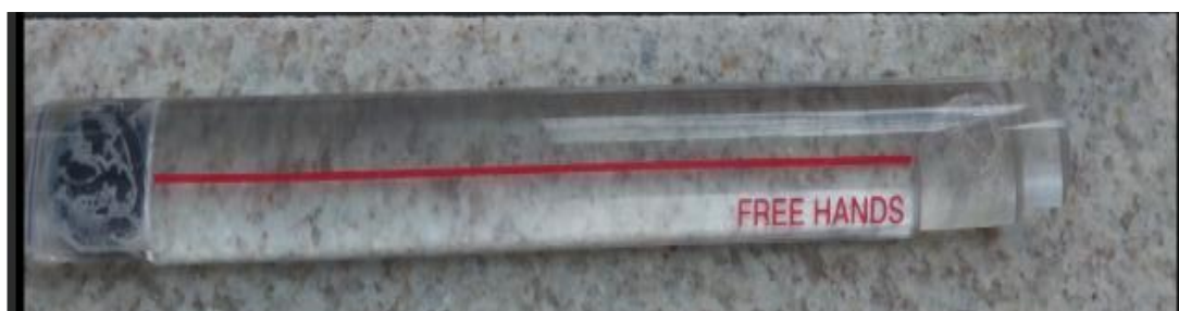
Figura 1 – Lupa de régua da estudante A

Quanto aos recursos utilizados pela Estudante A, o celular é o preferido da estudante, por ser mais prático e fácil de carregar. Ela começou a utilizar a lupa de régua recentemente e afirmou que gostava desse recurso, levava sempre no fichário. A seguir, a Figura 1 mostra uma foto do recurso enviada pela própria estudante: