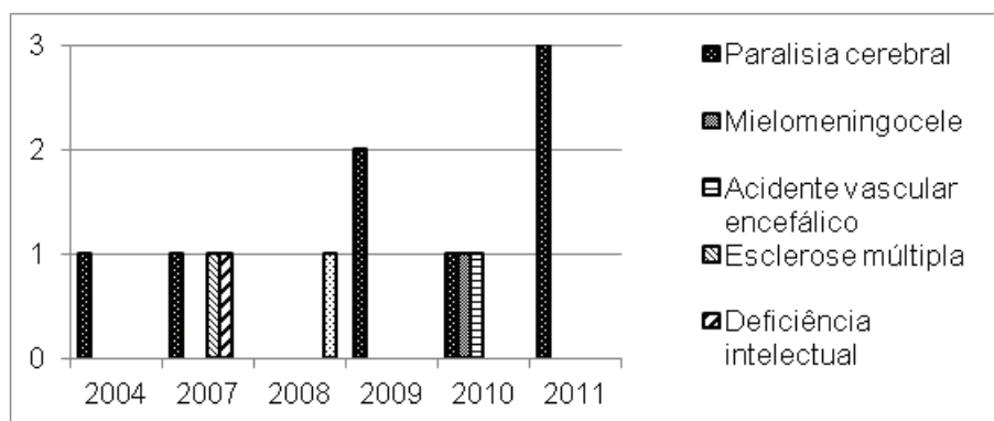
Figura 2: Gráfico referente às populações beneficiadas com a prática equoterapêutica

Nota-se que a grande maioria dos estudos equoterápicos é direcionada a pessoas com paralisia cerebral (PC), no entanto, verificou-se que populações diversificadas são beneficiadas pela prática equoterapêutica, como é possível observar na figura 2.