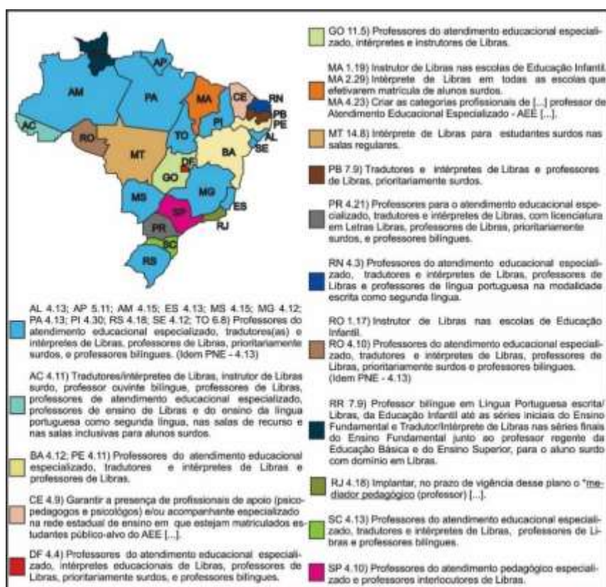
Figura 1 – Equipe de profissionais para o atendimento educacional dos estudantes surdos nos sistemas estaduais e distrital de ensino

Tendo em vista que, no processo de recontextualização do PNE-2014, para composição dos respectivos PEEs e PDE, a estratégia 4.13 – referente à composição da equipe de profissionais para o atendimento educacional dos estudantes surdos – foi reiterada em 25 dos 27 Planos de Educação mencionados; com base nos excertos elencados no mapa apresentado a seguir, analisa-se em que medida as propostas previstas nos PEEs e no PDE coincidem ou contrastam com as proposições do PNE-2014, o quanto as equipes de profissionais situadas nos Planos de Educação investigados correspondem às determinações do Decreto Federal nº 5.626/2005, e quais os limites e possibilidades das medidas previstas nos documentos em questão, para a consolidação de uma proposta educacional atenta aos direitos linguísticos e à condição bilíngue prescrita aos estudantes surdos, no Brasil.