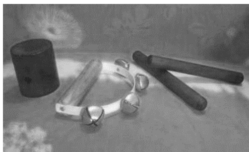
Figura 1 - Foto dos instrumentos utilizados no estudo, da esquerda para a direita: chocalho, guizo e par de clavas

Foram selecionadas, inicialmente três cantigas e três instrumentos musicais (ver Figura 1). A cantiga “Carneirinho, carneirão” foi introduzida para P4, pois, na presença da cantiga “Capelinha de Melão”, o participante apresentou comportamentos incompatíveis com a atividade, como tampar os ouvidos e recusar-se a realizá-la. Para a escolha da cantiga “Carneirinho, carneirão” o pai do participante indicou esta cantiga como uma das preferidas pelo filho. A seguir são apresentadas as cantigas e o comportamento esperado para cada uma. As quatro cantigas de roda selecionadas para esta pesquisa foram retiradas do livro de Pimentel (2002). Segundo Ilari (2002, p. 84), este tipo de cantiga possui “intervalos melódicos pequenos, ritmos bastante simples e uma quantidade grande de repetições de frases musicais”, sendo, portanto, ideal para trabalhar com os participantes deste estudo.