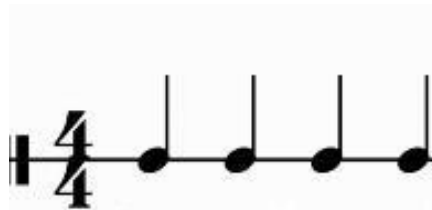
Figura 2 - Representação de um compasso escrito em tempo quaternário. O participante deveria tocar o instrumento musical em cada semínima

(4/4 – leia-se quatro por quatro) e o participante deveria tocar o chocalho no pulso da cantiga (Figura 2). Ao ouvir o início da cantiga, o participante deveria realizar movimentos verticais (de cima para baixo e vice-versa) com o chocalho, de forma contínua, a cada 48 décimos de segundos, aproximadamente, até o final da cantiga. Respostas corretas foram seguidas de acesso ou consumo do item de preferência.