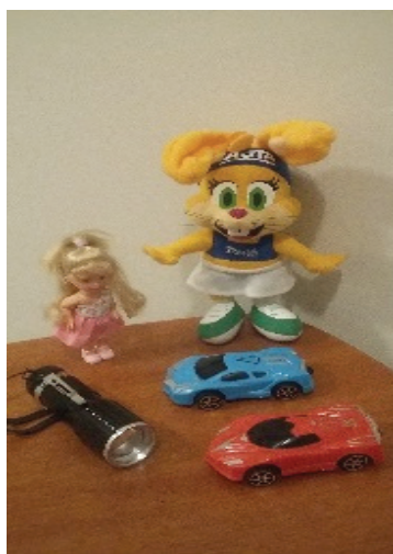
Figura 2 – Objetos utilizados na avaliação, por meio da observação do comportamento visual

A avaliação para verificar presença de resíduo visual também foi realizada por meio da observação do comportamento e objetivou apreender a resposta visual das crianças com deficiência visual associada à múltipla deficiência. Para sua aplicação, a pesquisadora fez uso de lanterna de pilhas comuns com foco pequeno (3 cm de diâmetro), brinquedos diversos (coelho de pelúcia de diâmetro aproximado de 14 cm, carrinho de diâmetro aproximado de 8 cm e boneca de diâmetro aproximado de 3,5 cm) e suporte branco para apresentação dos objetos, a fim de criar contraste adequado para facilitar a visualização pelos participantes, conforme apresentado na figura 2.