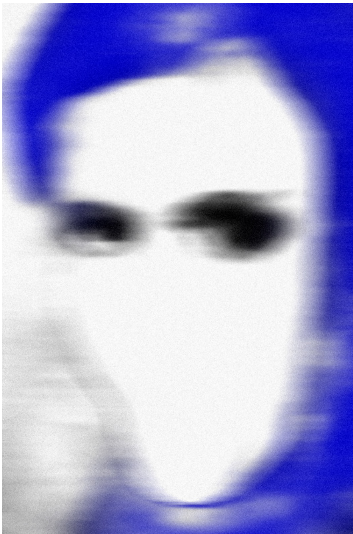
Raul Dotto Rosa, ADbdy006 [body], 2020, imagem digital, 1181 x 1772 px