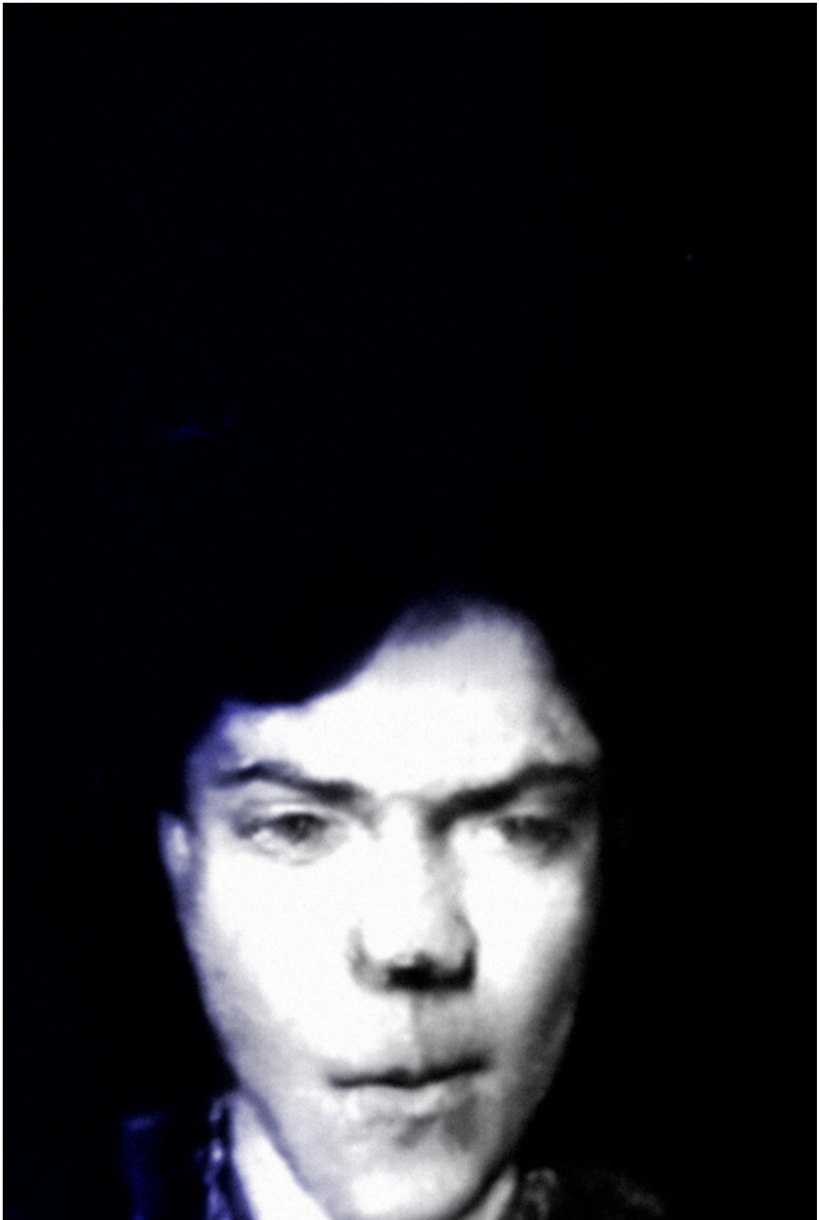
Raul Dotto Rosa, ADbody003 [body], 2020, imagem digital, 1181 x 1772 px