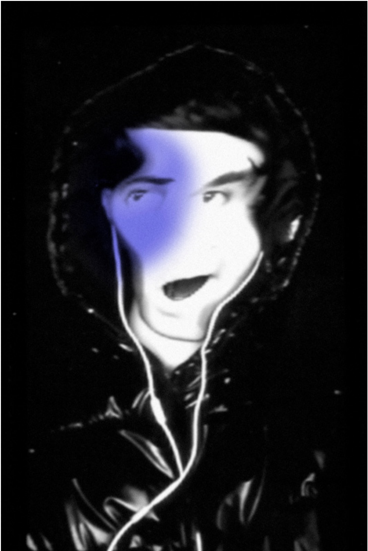
Raul Dotto Rosa, ADphscn008 [phantom scan], 2020, imagem digital, 1181 x 1772 px