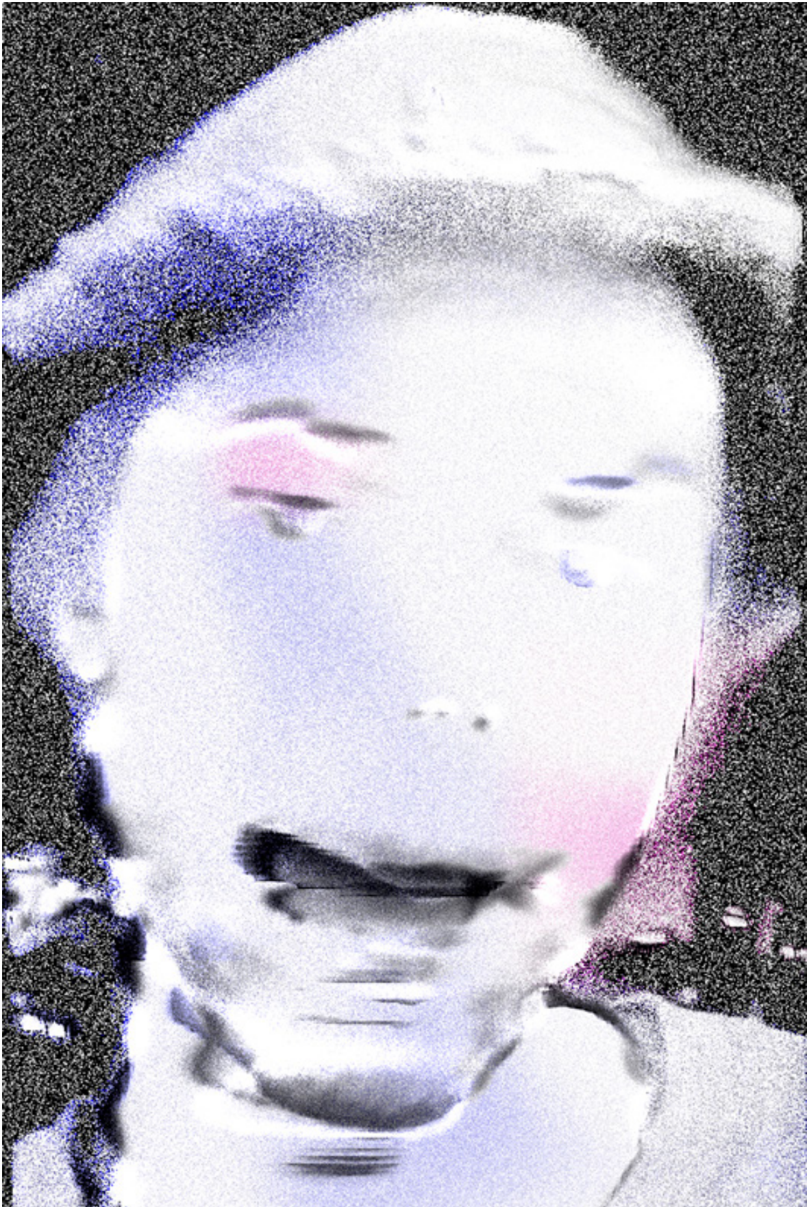
Raul Dotto Rosa, ADh'ps 2 [happiness], 2020, imagem digital, 1181 x 1772 px