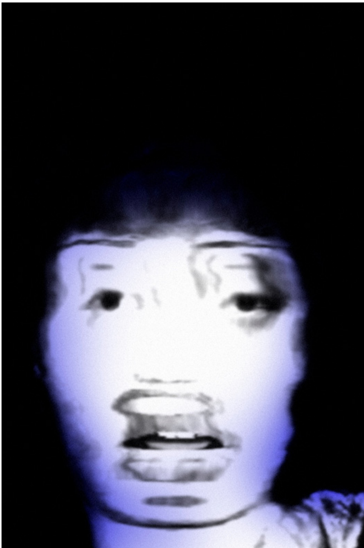
Raul Dotto Rosa, ADwvs008 [waves], 2020, imagem digital, 1181 x 1772 px