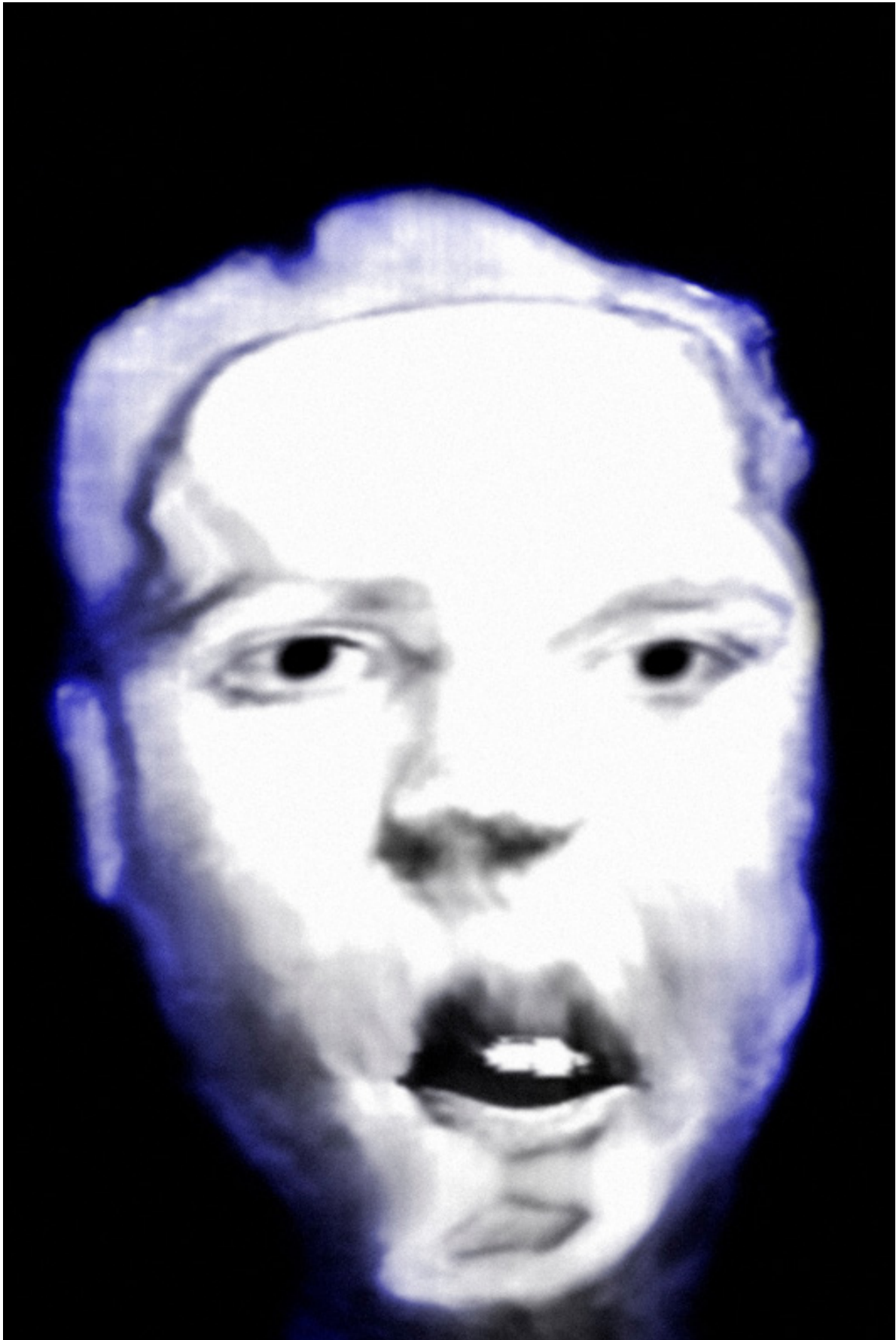
Raul Dotto Rosa, ADwvs005 [waves], 2020, imagem digital, 1181 x 1772 px