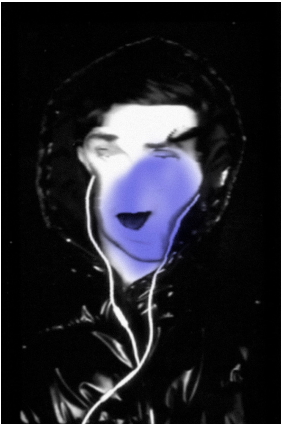
Raul Dotto Rosa, ADphscn009 [phantom scan], 2020, imagem digital, 1181 x 1772 px