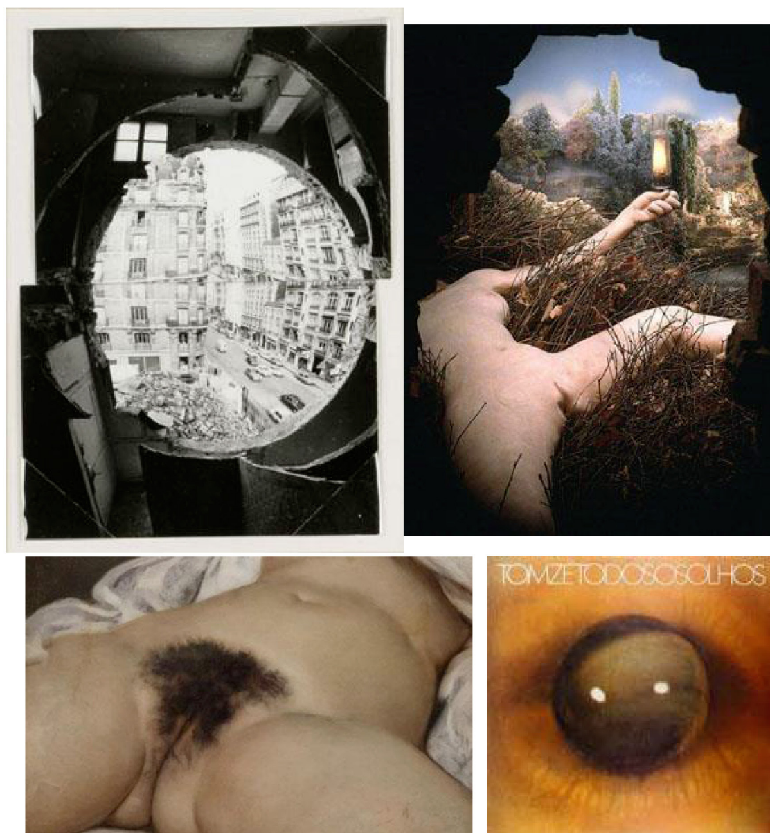
Figura 2. Gordon Matta-Clark, Marcel Duchamp, Gustave Courbet, Décio Pignattari, Conical Intersect (1975), Etant Donnés (1946-1969), L'Origine du monde (1866) e Todos os Olhos (1971)

Furos são sempre entradas para mundos, efeitos de expansão, exposição, expressão diante de universos. Implicam tempos diferentes, um acontecido e um porvir. Não tem um tempo, não pertencem ao tempo, a nenhum tempo, são não-tempos . Além de uma heterotopia , uma heterocronia . Uma borda entre dois ou mais estados diferentes. Um tempo sem tempo ou um tempo de muitos tempos.