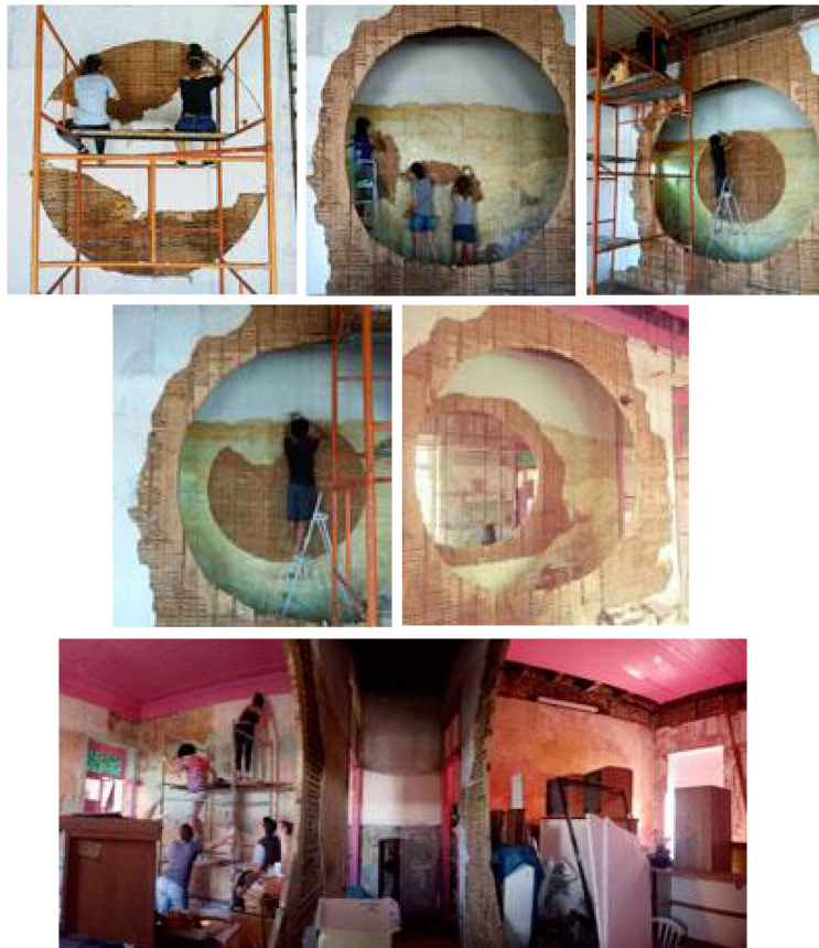
Figura 5. Os furos na Ksa Rosa. Acervo de imagens da Ksa Rosa. Porto Alegre, 2019. Fonte: Acervo Ksa Rosa.