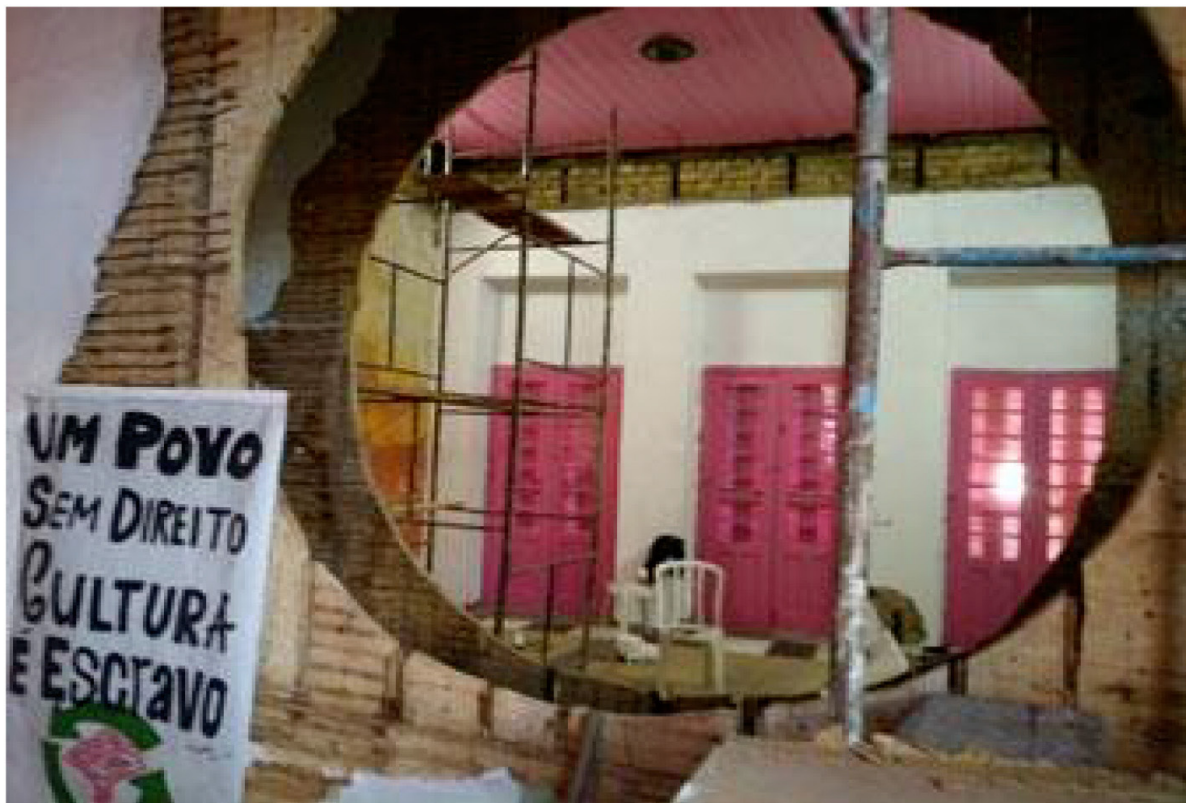
Figura 1. Dois óculos na Ksa Rosa.

Palabras clave: Ocupación Ksa Rosa; Arquitectura; Arte; Agujeros; Ciudad