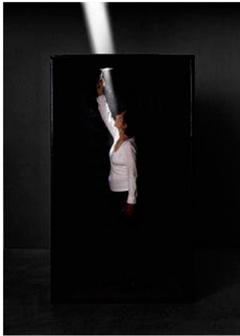
Figura 4. Lygia Pape e Faca de Luz (1975)