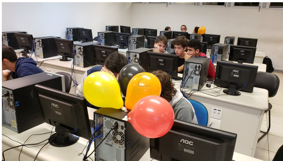
Figura 4. Maratona de programação júnior na Semana da Computação da UFJF em 2019.

Os temas abordados nas três últimas edições são, em sua grande maioria, orientados para o mercado de trabalho, mas alguns são voltados para a área acadêmica. Também, possui espaço para assuntos voltados para os cursos, exemplificando a mesa redonda sobre a vivência interdisciplinar da Computação e Engenharia, comemorando os 10 anos de criação do curso de Engenharia Computacional na edição de 2018, organizada pelo GET EngComp. Nos últimos anos, tem sido organizadas maratonas de programação (Figura 4), diferenciando discentes nos períodos iniciais dos mais avançados.