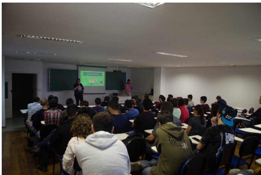
Figura 2. Palestra na Semana da Computação da UFJF em 2017.

É realizada nas dependências do ICE, no campus sede da UFJF. Para o incentivo da participação discente e a liberação do espaço, o departamento não oferta aula durante o evento. Em todas as edições, possui diversas palestras e minicursos (Figuras 2 e 3). Nos últimos anos, foi visto também na Semana da Computação visitas técnicas, noite de jogos e feira de empresas, com oportunidades de estágio. É aberto a todo o público acadêmico e à comunidade externa, com programação de manhã, tarde e noite devido à existência de cursos no período integral e noturno. Nas três edições, 2017 a 2019, a duração foi de três dias.