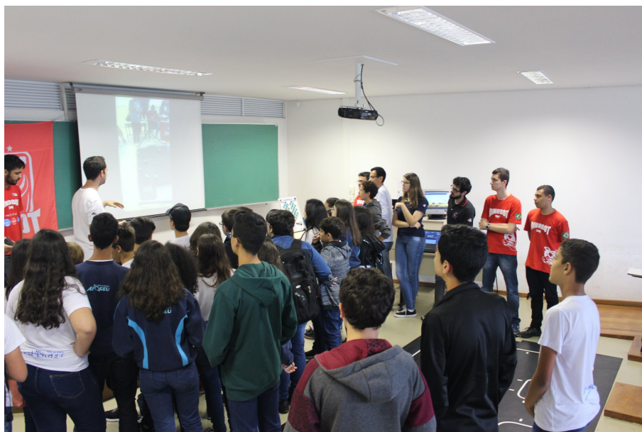
Figura 1. Mostra da equipe de competição Rinobot Team, durante a XXIX Feira de Ciências do ICE em 2018, para estudantes do ensino básico.

Também, é um dos eventos que compõem a Semana do Instituto de Ciências Exatas (ICE) da UFJF, o qual, há mais de 20 anos, reúne todas as semanas acadêmicas dos departamentos do instituto (Estatística, Química, Matemática, Física e Ciência da Computação) e, nos últimos anos, coincide com a realização da Semana Nacional de Ciência e Tecnologia, uma ação ao nível nacional mobilizada pelo Ministério da Ciência, Tecnologia e Inovações (MCTI) instituída a partir do decreto de 9 de junho de 2004 [Brasil 2004]. Com a reunião das semanas acadêmicas do ICE, também é realizada uma feira de ciências, de trabalhos elaborados por estudantes das escolas de ensino fundamental e médio, públicas e particulares, de Juiz de Fora e região [UFJF 2018]. E uma mostra dos cursos do instituto com a participação da comunidade acadêmica do instituto e de segmentos estudantis da Faculdade de Engenharia, como equipes de competição e o Ramo Estudantil IEEE (Figura 1).