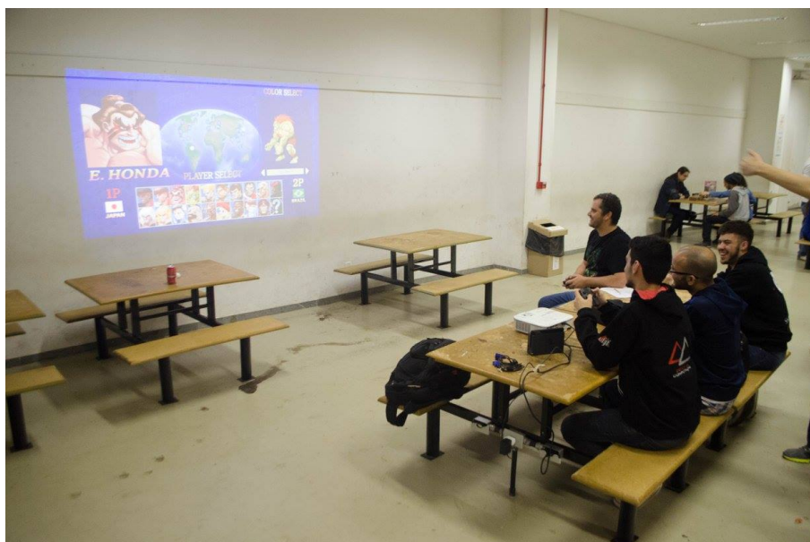
Figura 5. Noite de jogos na Semana da Computação da UFJF em 2017.

manhã, tarde e noite, é importante oferecer coffee breaks para que os participantes que queiram acompanhar eventos em mais de um turno não precisem deixar o local. Para escapar da falta de recursos, foram buscados parceiros da área de alimentação para fazerem divulgação no evento, inclusive entrega de panfletos, em troca de ofertar alimentos para o coffee break .