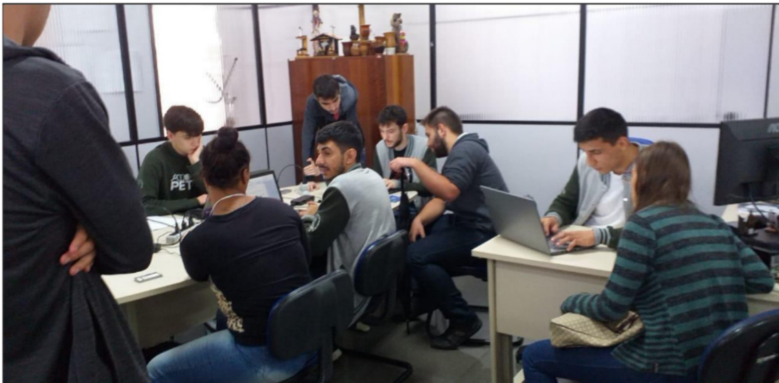
Figura 3. Momento de funcionamento da oficina, onde os membros do PET atendiam aos participantes do evento.

Em contrapartida, esta abordagem faz com que o número de atendimentos seja limitado, por realizar um atendimento individual com cada candidato. Enquanto na edição de 2018 até 40 pessoas poderiam ser atendidas em 30 minutos (no formato seminário), em 2019 dependia do número de monitores disponíveis. Como eram 5 monitores atuando em paralelo e cada um conseguia elaborar 2 currículos a cada 30 minutos, o número de pessoas atendidas caiu de 40 para 10, no mesmo período.