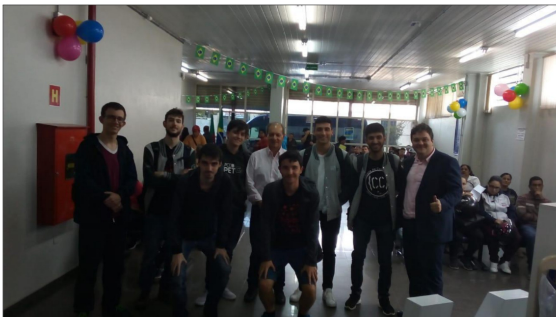
Figura 4. Membros do PET junto a parte da comissão organizadora do evento.