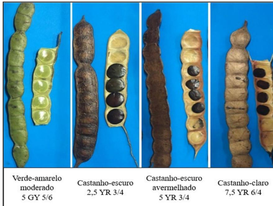
Figura 1 – Classificação das sementes de Anadenanthera colubrina em diferentes estádios de maturação, de acordo com a cor do fruto. Setembro de 2017, Marechal Cândido Rondon, Paraná, Brasil