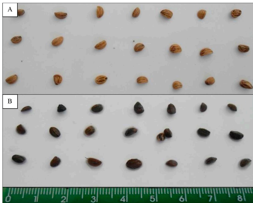
Figure 1 – External appearance of yerba mate seeds. (A) seeds not submitted to the stratification process; (B) seeds submitted to the 180-day stratification period.