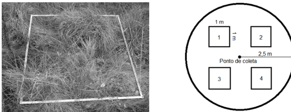
FIGURA 2: Delimitação de área de coleta (1 m 2 ) com moldura metálica e disposição das coletas sazonais de material em vegetação de Estepe Gramíneo-Lenhosa na Reserva Particular do Patrimônio Natural Caminho das Tropas, município de Palmeira, estado do Paraná.

Para as coletas utilizou-se moldura metálica de 1 m 2 que era depositada ao lado do ponto de amostragem em uma área circular de entorno de raio de 2,5 metros. Para cada ponto, 4 coletas foram realizadas, cada uma em uma estação climática distinta do ano (Figura 2).