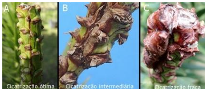
FIGURA 1: Classificação da cicatrização dos enxertos: A) cicatrização ótima (perfeita união enxerto e porta-enxerto); B) cicatrização intermediária (união entre enxerto e porta-enxerto com presença de tecidos ressecados); C) cicatrização fraca (bordas do enxerto desalinhadas com o porta-enxerto e ressecadas).

Os dados foram analisados por meio de estatística descritiva. Foi calculado o coeficiente de correlação de Pearson entre as variáveis “distância dos verticilos até o ápice” e “ângulo da brotação”; “distância dos verticilos” e “comprimento das brotações”.