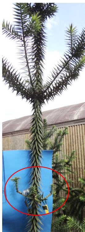
FIGURA 3: Comportamento de crescimento de enxertos de Araucaria angustifolia realizados nos ramos do terceiro verticilo, 180 dias após a enxertia.