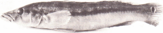
Figura 2 - ZSM 001012 (macho)-287,0 mm de comprimento total.