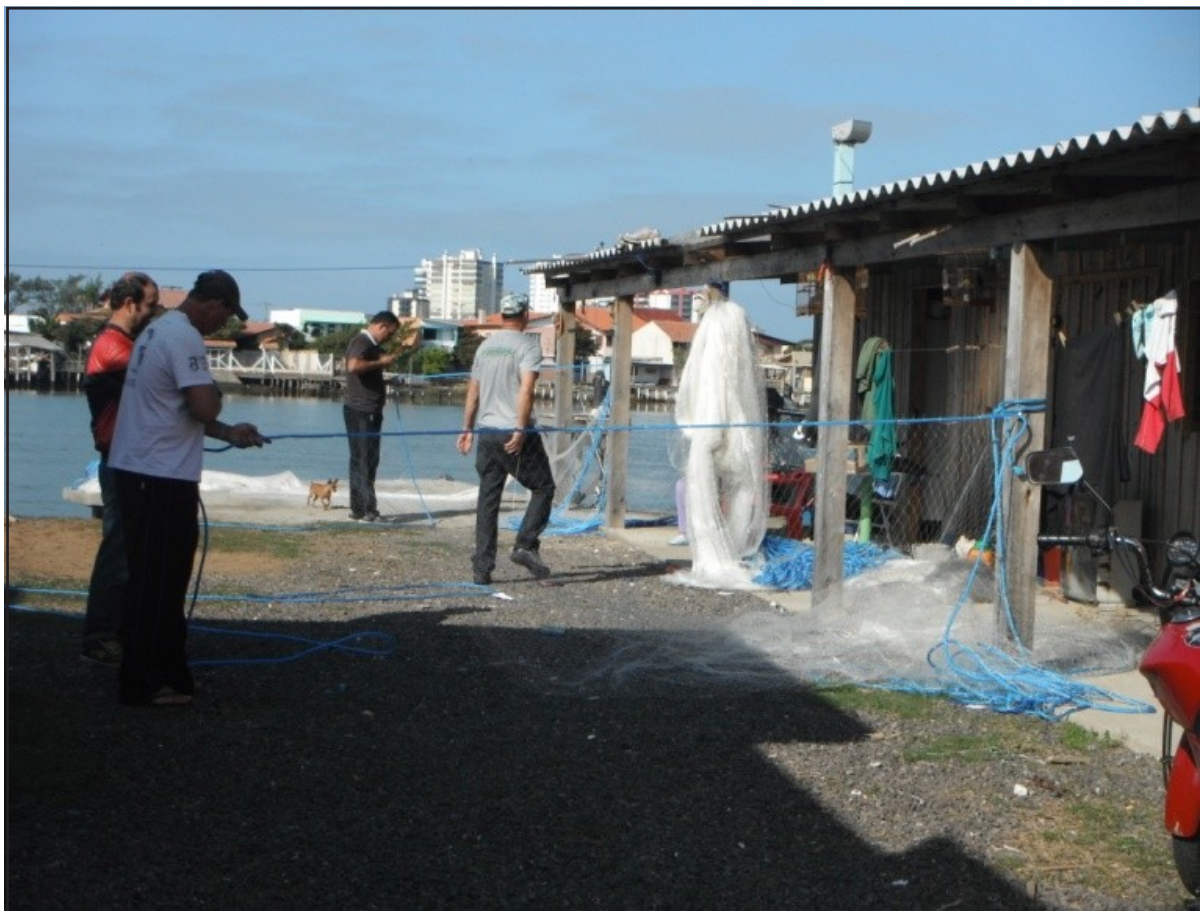
Figura 3 – Pescadores e seus petrechos de pesca

Desta forma, alguns pescadores começaram a explorar as lagoas costeiras, outros optaram pela exploração do estuário da laguna de Tramandaí e muitos se espalharam pela longa beira de praia da faixa costeira. Segundo os pescadores, isso ocorre devido aos poucos recursos disponíveis para a realização desse tipo de pescaria e também pelas dificuldades de acesso as regiões.