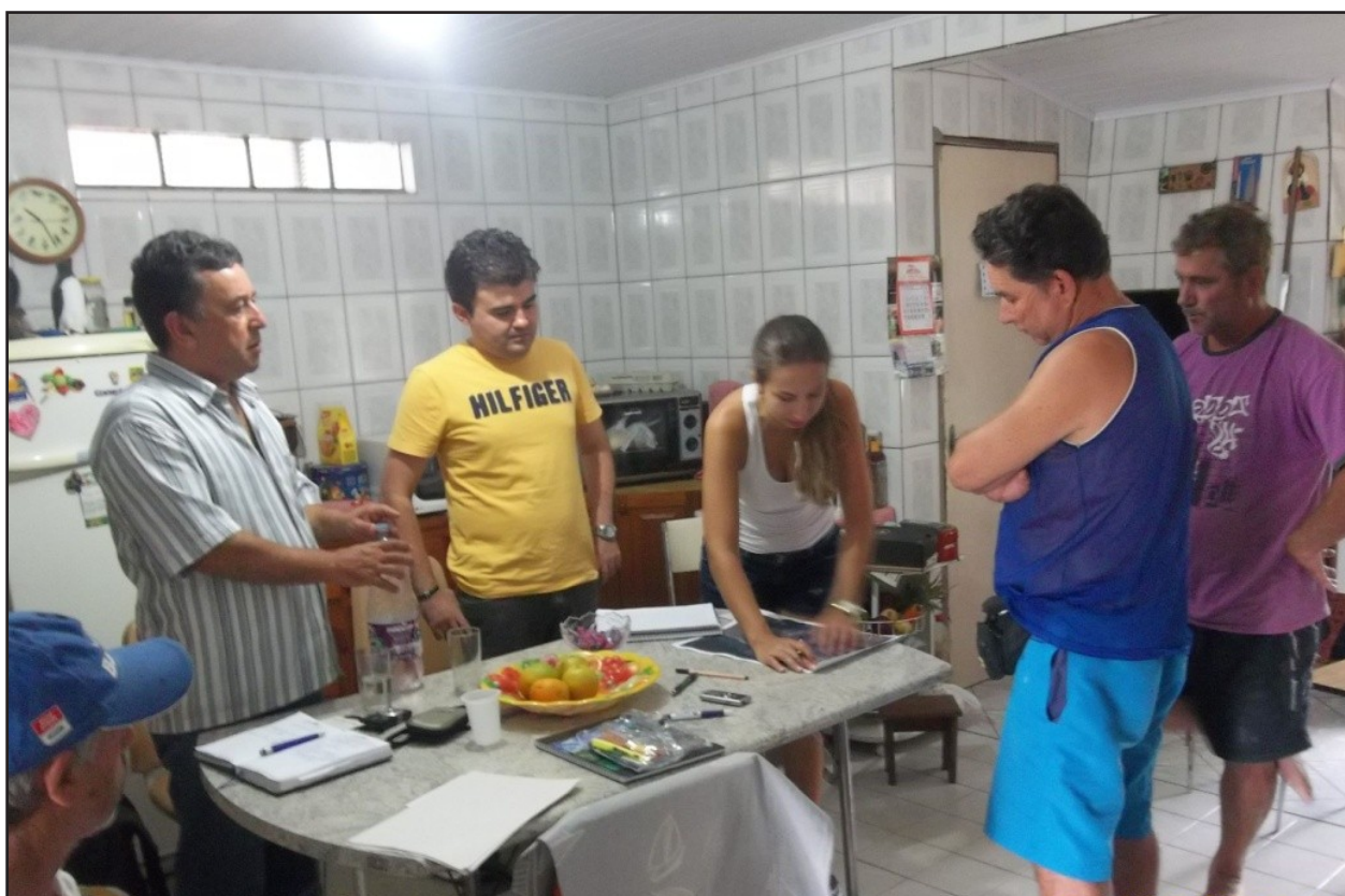
Figura – 2 Oficinas participativas

As oficinas (figura 2) tiveram o objetivo central de identificar os principais pontos de prática da atividade pesqueira, os instrumentos utilizados, as espécies capturadas, os costumes desse grupo social e os problemas enfrentados para a realização da pesca.