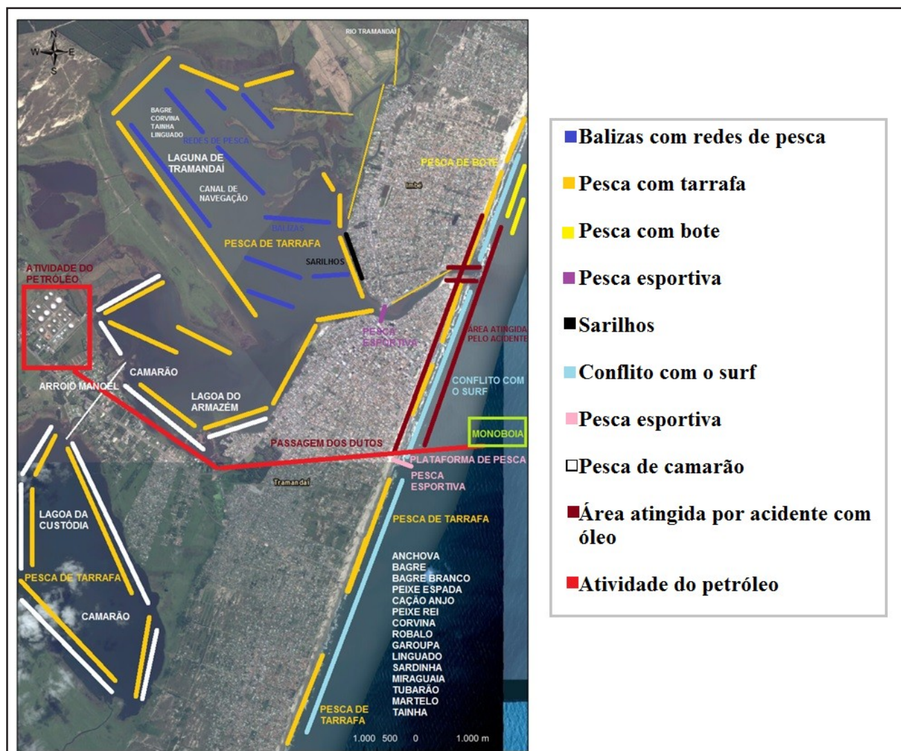
Figura 5 – Mapa mental das áreas de pesca em Tramandaí e Imbé

Esses fatores são os responsáveis pela caracterização do cenário pesqueiro da região e podem ser observados de acordo com o produto gerado (figura 5), através da aplicação das oficinas participativas realizadas com os pescadores artesanais.