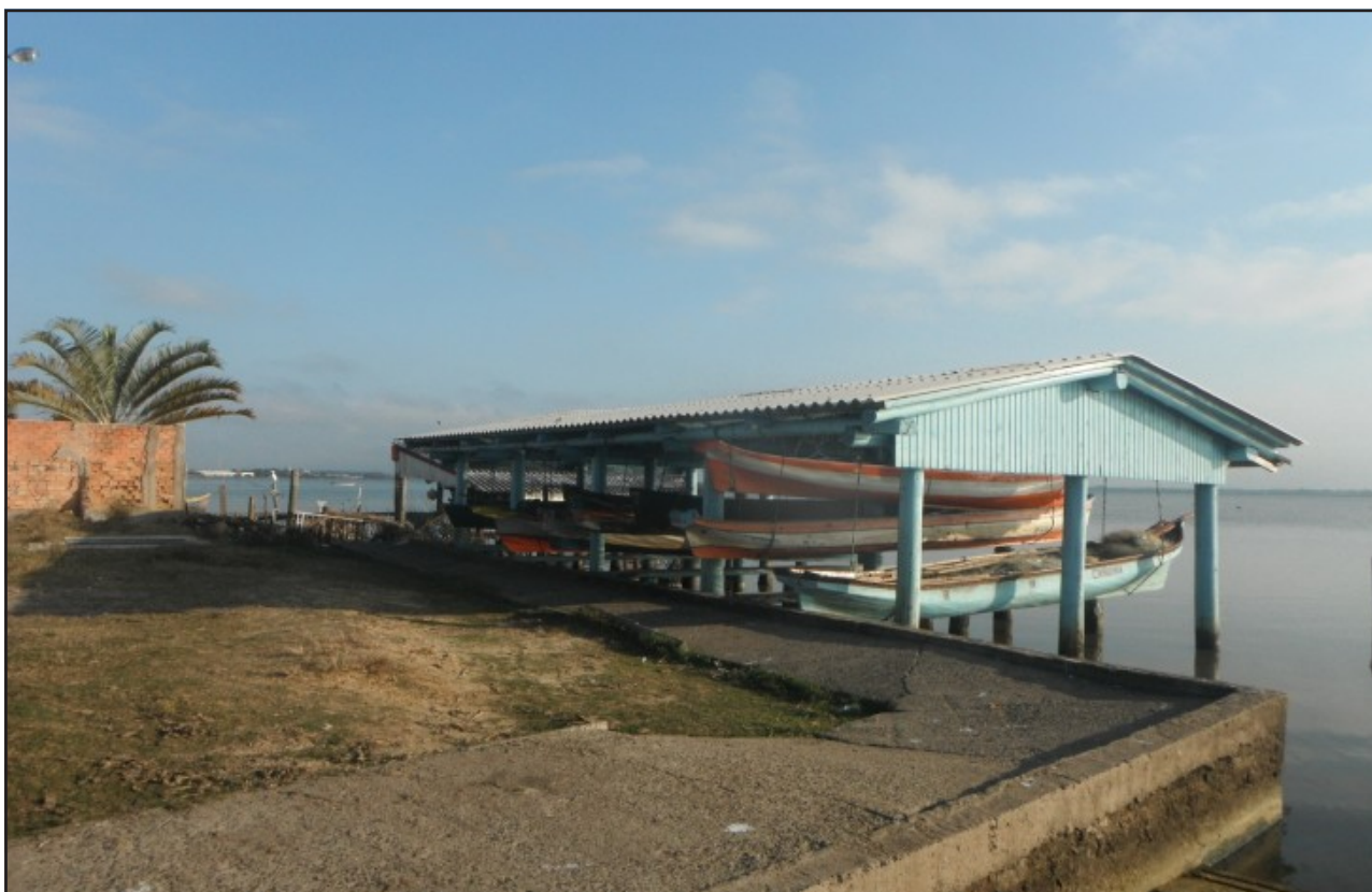
Figura 4 – O sarilho