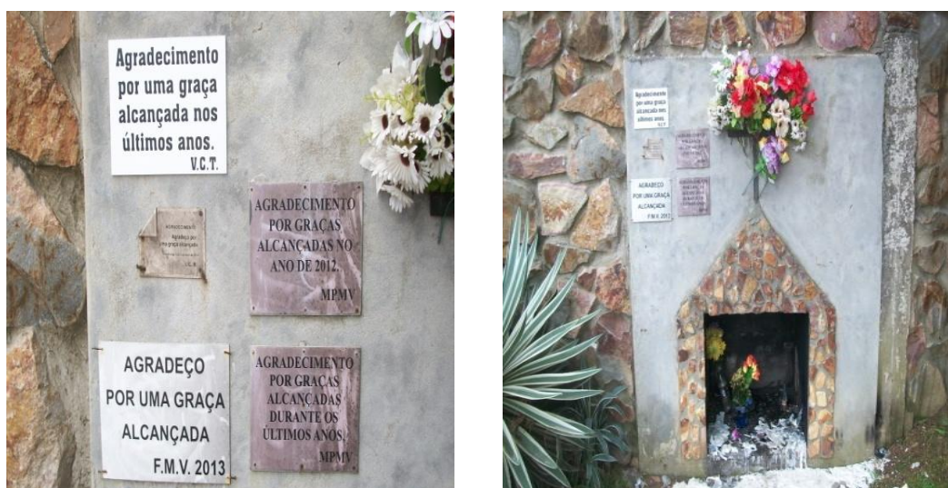
Figuras 8 - A Capela dos “Noivinhos” na Rua Antônio Trilha, São Gabriel/RS e placas no local em agradecimento a graças alcançadas..