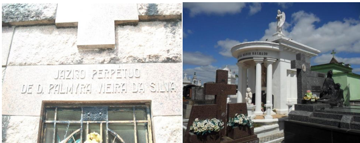
Figuras 2A e 2B - Mausoléus de família tradicionais no Cemitério da Irmandade da Santa Casa de Caridade de São Gabriel, São Gabriel, RS.

Na ala antiga estão os túmulos com maior importância histórica, arquitetônica e artística. No local encontramos túmulos com esculturas de anjos, crianças, figuras femininas, cristos, entre outras. A grande maioria dos jazigos, mausoléus ou túmulos foram construídas no início do século passado, em mármore branco, conforme Figuras 2A e 2B.