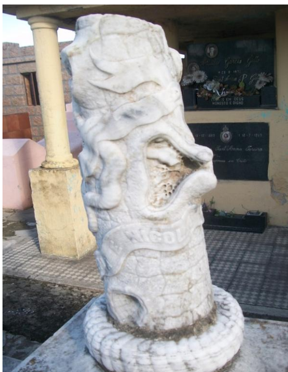
Figuras 4 - Monumento do tipo Obelisco no Cemitério da Irmandade da Santa Casa de Caridade de São Gabriel, São Gabriel, RS

Este monumento foi transportado para a Praça interna da Irmandade da Santa Casa de Caridade de São Gabriel para sua preservação sendo que no Cemitério estava sendo depredado, porém hoje se encontra novamente no Cemitério, conforme Figura 4.