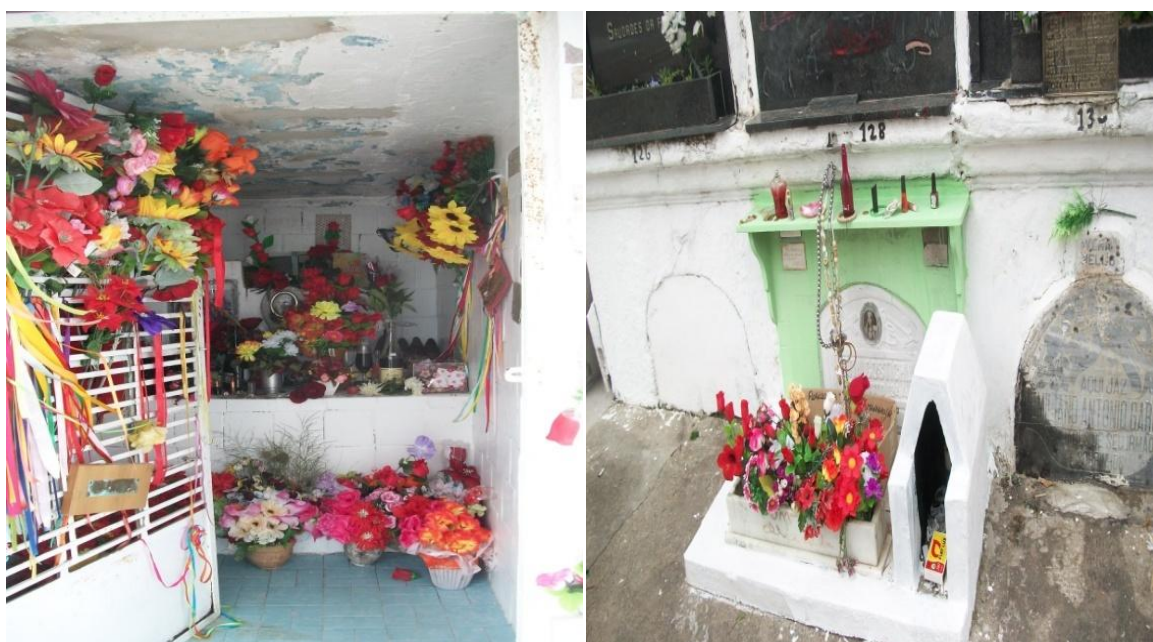
Figuras 5 - A- Capela da Guapa ornamentada com flores, velas e demais objetos. B- Capela da Cigana. Ambos os locais situados no Cemitério da Irmandade da Santa Casa de Caridade de São Gabriel, São Gabriel, RS.

Neste sentido, segundo Thompson (2014) percebe-se que a existência dos túmulos e dos monumentos evoca a construção de rituais. Nestes dois casos dentro do cemitério atribuem-se milagres a estas duas personagens do imaginário popular observando-se em seus túmulos a presença de velas, flores, placas em agradecimento por graças alcançadas.