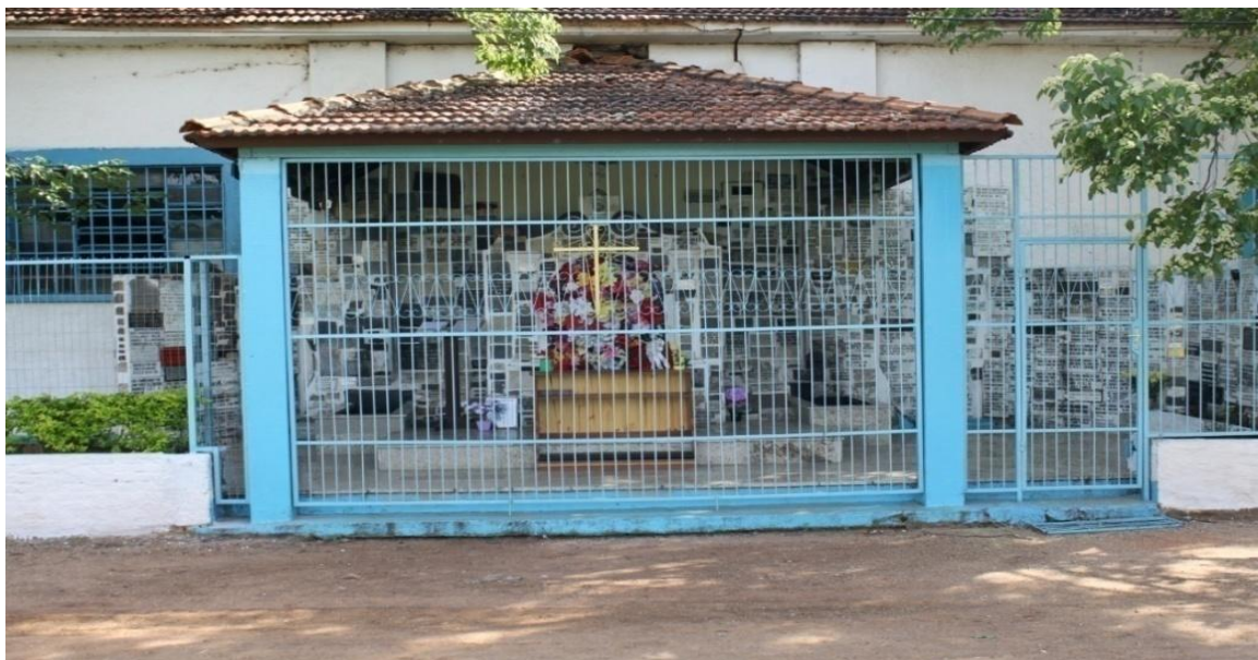
Figura 6 - Capela dos Fuzilados junto ao 6º Batalhão de Engenharia de Combate. São Gabriel, RS

Monsenhor Henrique Rech chegou a São Gabriel, a 3 de setembro de 1909. A Igreja Matriz estava por terminar. Durante 14 anos dedicou-se a conclusão deste templo.