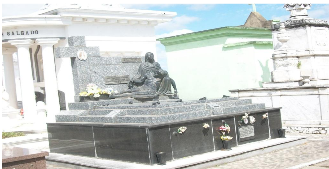
Figuras 3 - Expressão artística através de esculturas no Cemitério da Irmandade da Santa Casa de Caridade de São Gabriel, São Gabriel, RS

Em geral, observou-se que as construções tumulares estão muito alteradas no que se refere à preservação e em bom estado quanto à conservação.