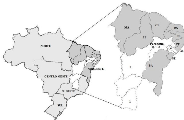
Figura 1 – Regiões geográficas do Brasil com destaque para a Região Nordeste e seus estados. A bacia hidrográfica do Rio São Francisco com suas subdivisões é apresentada na cor branca. A subdivisão 1 é o Alto São Francisco, a 2 o Médio São Francisco, a 3 o Submédio São Francisco (com destaque para a localização da estação de altitude de Petrolina) e a 4 o Baixo São Francisco.

do vento. Esses dados possibilitaram determinar a componente zonal ( u ) e meridional ( v ) do vento e as seguintes variáveis termodinâmicas: pressão de vapor ( e ), temperatura potencial ( \theta ), potencial equivalente ( \theta_e ) e potencial equivalente de saturação ( \theta_{es} ), calculadas conforme Bolton (1980).