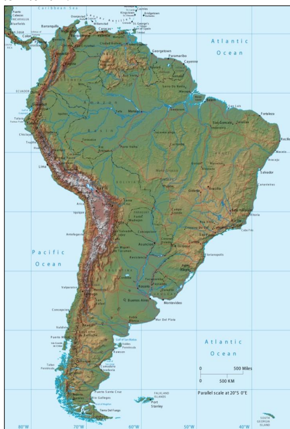
Figura 1 – Configuração territorial da América do Sul com diversos países de dimensões menores, em contraste com o Brasil. Fonte: Atlas Mundial DK.

O contexto territorial do continente sul americano desperta a atenção para o fato de a América Portuguesa ter originado um país de grandes dimensões, enquanto a América Espanhola desdobrou-se em diversos estados-nação. Este fato é explicado pelos historiadores por diversos argumentos, entre eles, a vinda da coroa portuguesa ao Brasil transformando a colônia em vice-reino. A presença da família imperial e seus deslocamentos internos teriam favorecido a unicidade territorial do que viria a ser o Brasil moderno. As viagens de D. Pedro II, tanto internamente como ao exterior buscando promover o Brasil e atrair colonos também teriam contribuído para o povoamento e, conseqüentemente, para a manutenção territorial 1 .