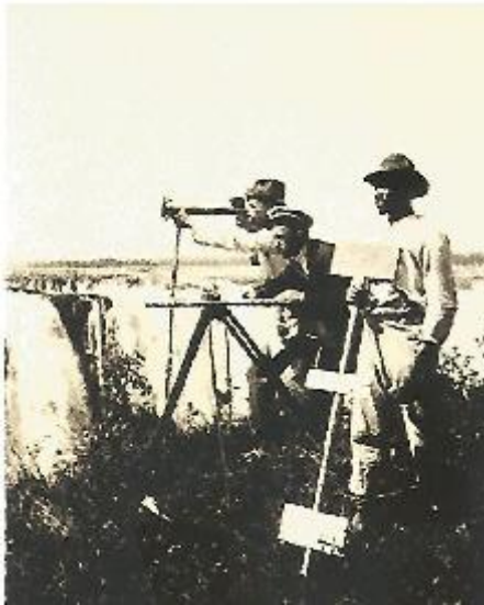
Figura 2 – Comissão Geográfica e Geológica de São Paulo fazendo reconhecimento do território, em Salto dos Patos, no rio Grande, na divisa entre Minas Gerais e São Paulo (1910).