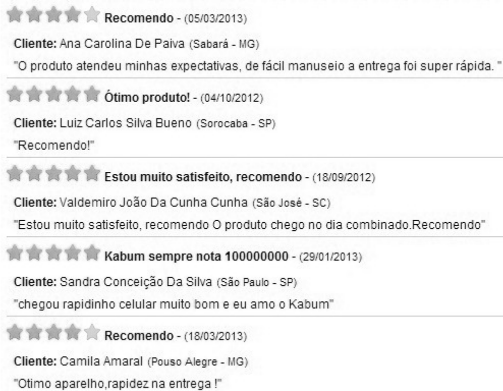
Figura 1: Avaliação de um produto na loja virtual Kabum

Porém, mesmo os consumidores menos engajados em buscar referências sobre um produto ou serviço antes de decidir pela marca X ou pela marca Y acabam se deparando com o “boca a boca” involuntariamente. Hoje, praticamente todas as grandes lojas online oferecem a possibilidade do cliente avaliar o produto comprado através de comentários ou simplesmente uma nota numérica ou ranqueamento por estrelas, por exemplo (ver Figura 1).