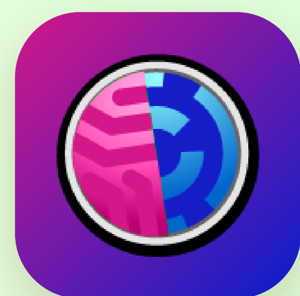
Digital Replay System