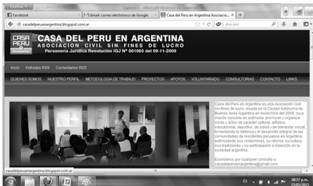
Figura 1 Sitio Web Casa del Perú

El tema que predomina es la solidaridad y se manifiesta en la concreción de proyectos culturales, habitacionales y sanitarios (ampliación de derechos civiles y sociales). Otras temáticas sobresalientes refieren a la unificación de la colectividad, a la circulación de la cultura peruana y a la transmisión de las experiencias de los residentes en la Argentina hacia las nuevas generaciones. En consecuencia, Casa del Perú se posiciona, por un lado, como un enunciador pedagógico que conduce al grupo hacia la unión en el seno de la sociedad receptora. Por otro lado, construye una relación basada en la complicidad entre enunciador y destinatario (potenciales lectores-usuarios) que comparten códigos y generan lazos –solidarios–.