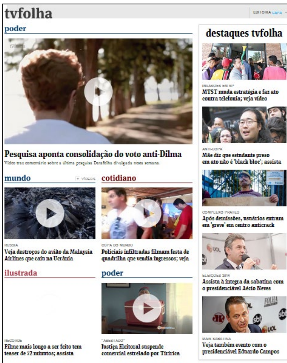
Figura 2: Capa do site da TV Folha.

da lógica da Internet oferecendo, inclusive, conteúdo exclusivo – nem sempre gratuito – para os usuários do ambiente digital.