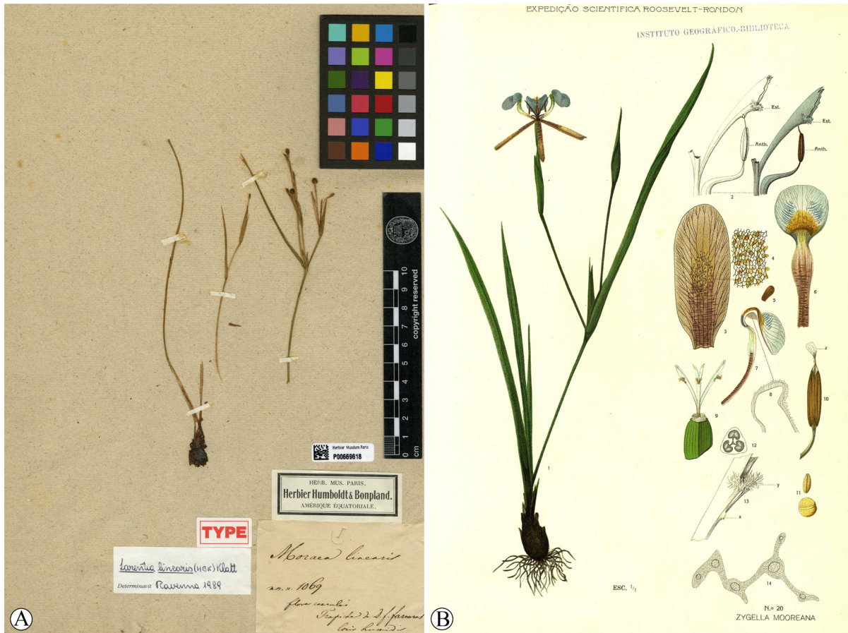
Figura 2. A. Larentia linearis colección tipo de Moraea linearis , depositada en el herbario de Paris (P00669618). B. Larentia linearis , epitipo de Zygella moreana , según Goldblatt & Celis (2010).

ser reconocida como un nombre válido perteneciente a la sección Cypella .