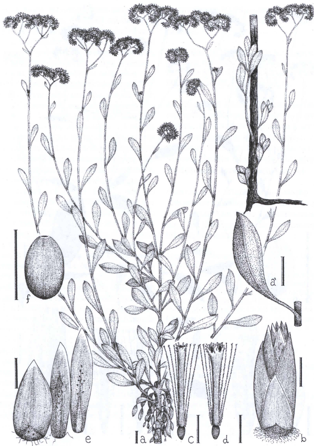
FIGURA 1 – Ramo de Achyrocline marchiorii (a). Folha (a'). Capítulo (b). Flor marginal (c). Flor do disco (d). Brácteas involucrais (e). Aquênio (f). Escala a, a' = 1 cm; b, c, d, e, f = 1 mm.