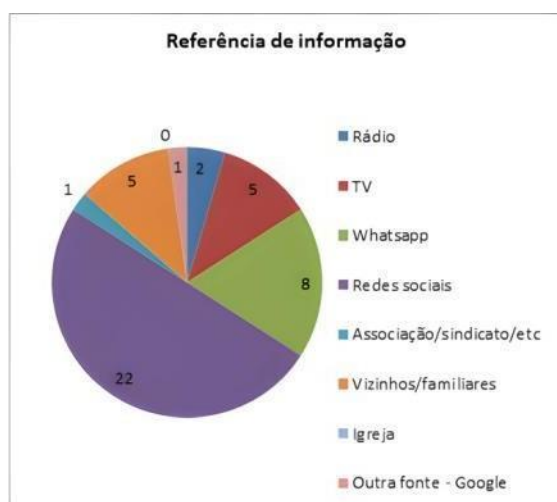
Figura 2 – Referência de informação

A maioria apontou as redes sociais online, especialmente o Facebook (22 menções), como suas fontes de informação de referência. Pessoas próximas como vizinhos e familiares, assim como a TV, receberam 5 menções. O Whatsapp recebeu 3 menções. Rádio, Google e associações/sindicatos têm uma menção cada.