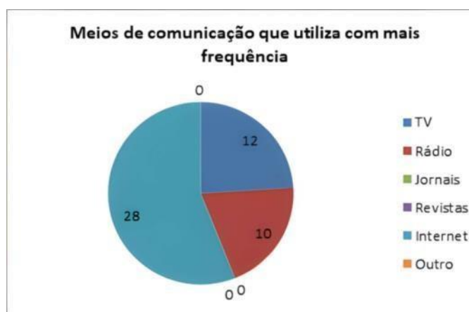
Figura 1 – Meios de comunicação

Em relação ao consumo de mídias, é notável a prevalência da internet frente a outros meios de comunicação. Questionadas sobre quais meios utilizam com mais frequência, as interlocutoras tinham a opção de mencionar mais de uma opção, mas a internet foi citada por 28 das 34 interlocutoras. Meios tradicionais, como a televisão e o rádio apareceram no segundo e terceiro lugares. Os materiais impressos, assim como verificados em pesquisa anterior (Borges, 2023), não são comuns no campo, e não foram mencionados nenhuma vez.