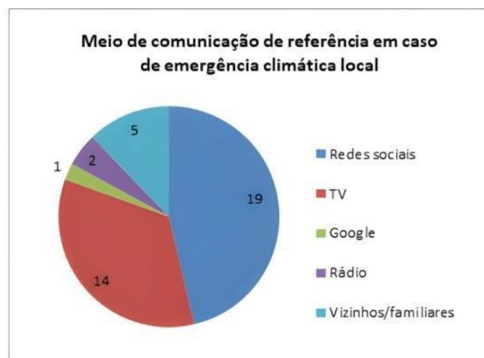
Figura 4 – Meio de comunicação de referência

entrevistados (81% de confiança, no caso do rádio, e 68%, no caso da mídia impressa) são os que menos têm acesso, com 47% e 41%, respectivamente.