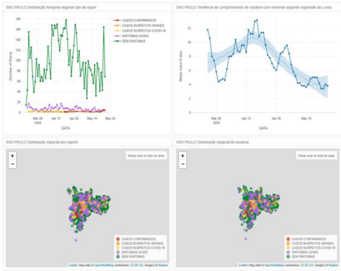
Figura 3 – Painel de reports “Brasil Sem Corona”

A estruturação do painel de reports envolveu adversidades em padronizar minimamente os dados das prefeituras. Conforme o desenvolvedor da iniciativa, os dados não eram digitalizados e a depender da Unidade Básica de Saúde (UBS) ou cidade é uma planilha feita a mão e, posteriormente digitalizada por servidores da prefeitura. Outra adversidade foi com a geolocalização trabalhada na Colab , visto que os dados da plataforma têm a geolocalização de forma instantânea, mas quando comparada com os dados da prefeitura, as ruas não eram exatamente as informadas pelos usuários. Em consequência, houve um esforço para transformar endereços em latitude e longitude, o que manteve a privacidade dos usuários e precisão para indicações dos casos.