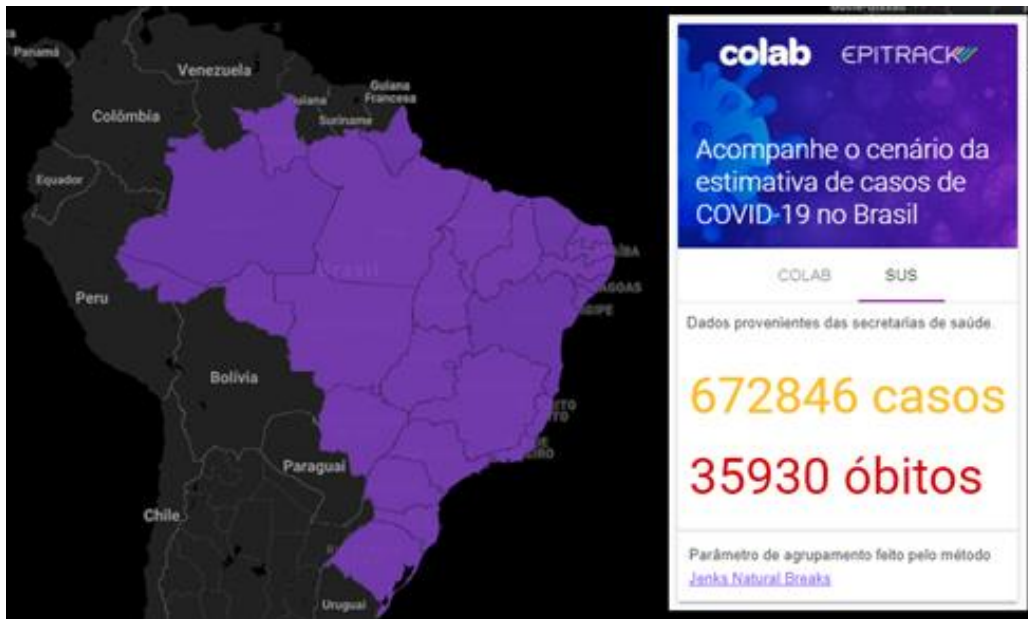
Figura 2 – Projeção de estimativa de casos da Covid-19 no Brasil pelo SUS, de acordo a interface do “Brasil Sem Corona”