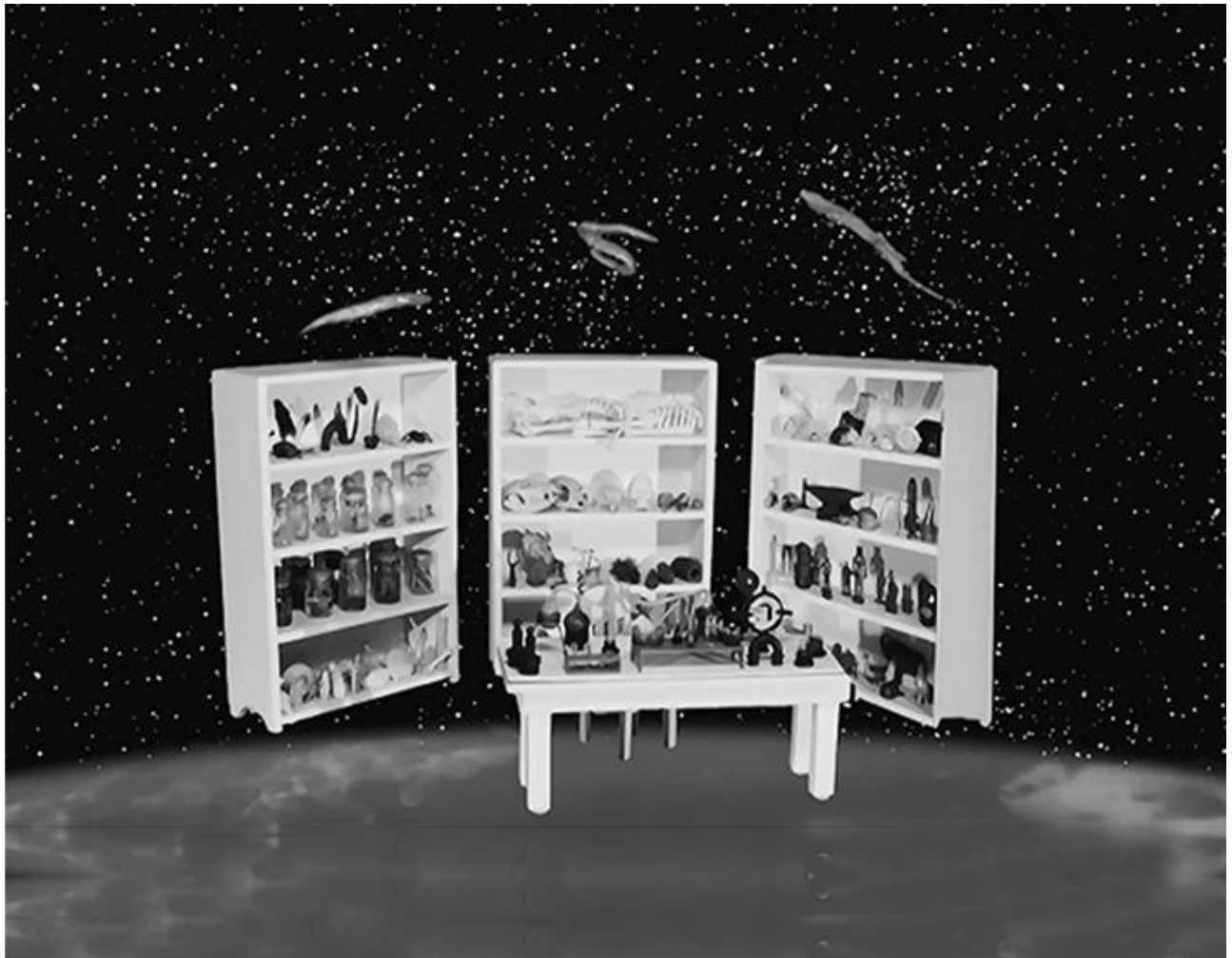
Figura 7 - Laboratório no espaço

Acredito que o mesmo ocorria nos antigos Wunderkammer : se a presa do narval correspondia visualmente ao chifre do unicórnio, isso era suficiente para que ela fosse incorporada como tal... O próprio Lichtenberg colecionou “todo o tipo de memorabilia ao seu alcance” (MATERNO, 1998, p. 39), o que, no filme, levou à criação do cenário onde acontece o encontro de Lichtenberg com Deus: um local imaginário, flutuando acima da Terra, onde está presente uma amostra geral das coisas do mundo (Figura 7).