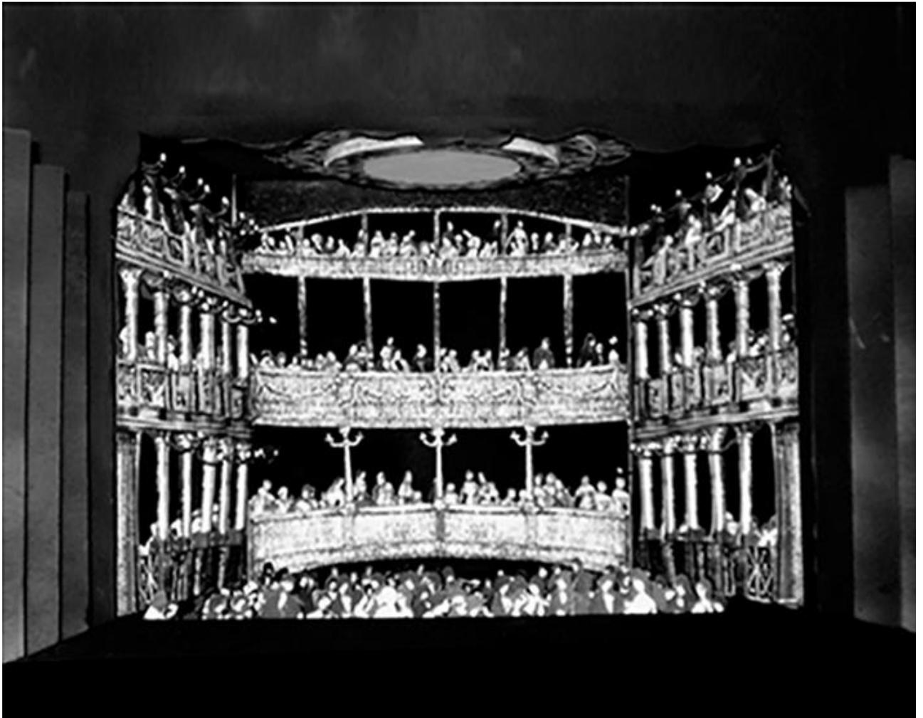
Figura 2 - Cenário do Teatro Drury Lane

No que concerne à cenografia, buscou-se estabelecer a maior proximidade possível entre os ambientes presentes na narrativa e seus correspondentes históricos: locais onde acontecem as sequências foram localizados na Internet e usados como referência para a criação das maquetes. Do teatro Drury Lane (Figura 2), por exemplo, ainda hoje existente em Londres, foi possível obter imagens da sua planta-baixa no século XVIII, vistas da plateia e do palco, existentes em gravuras e pinturas daquele período.