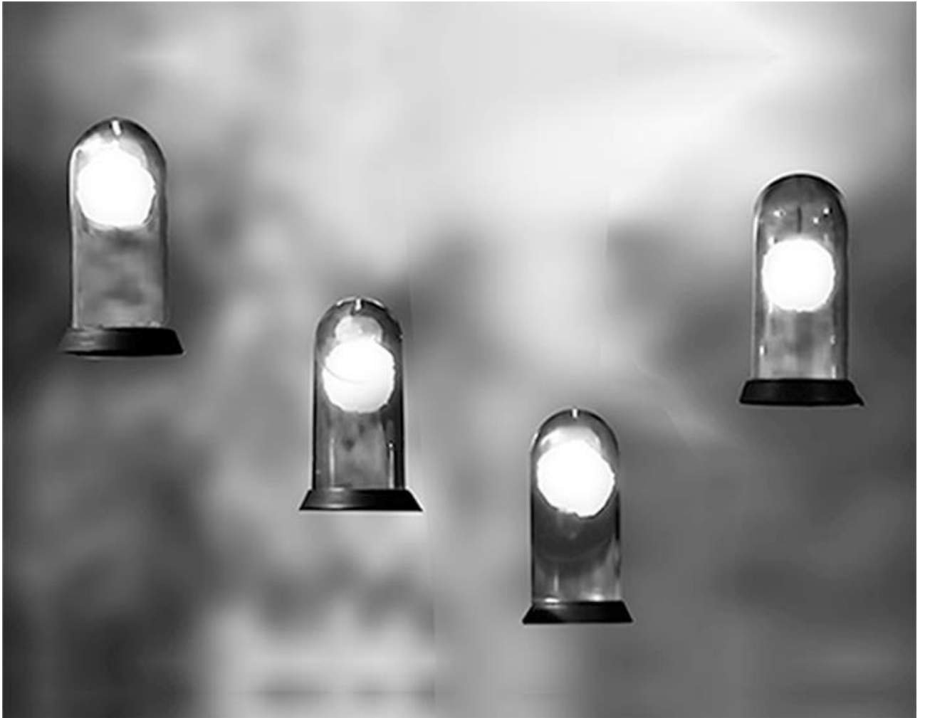
Figura 5 - Lunares