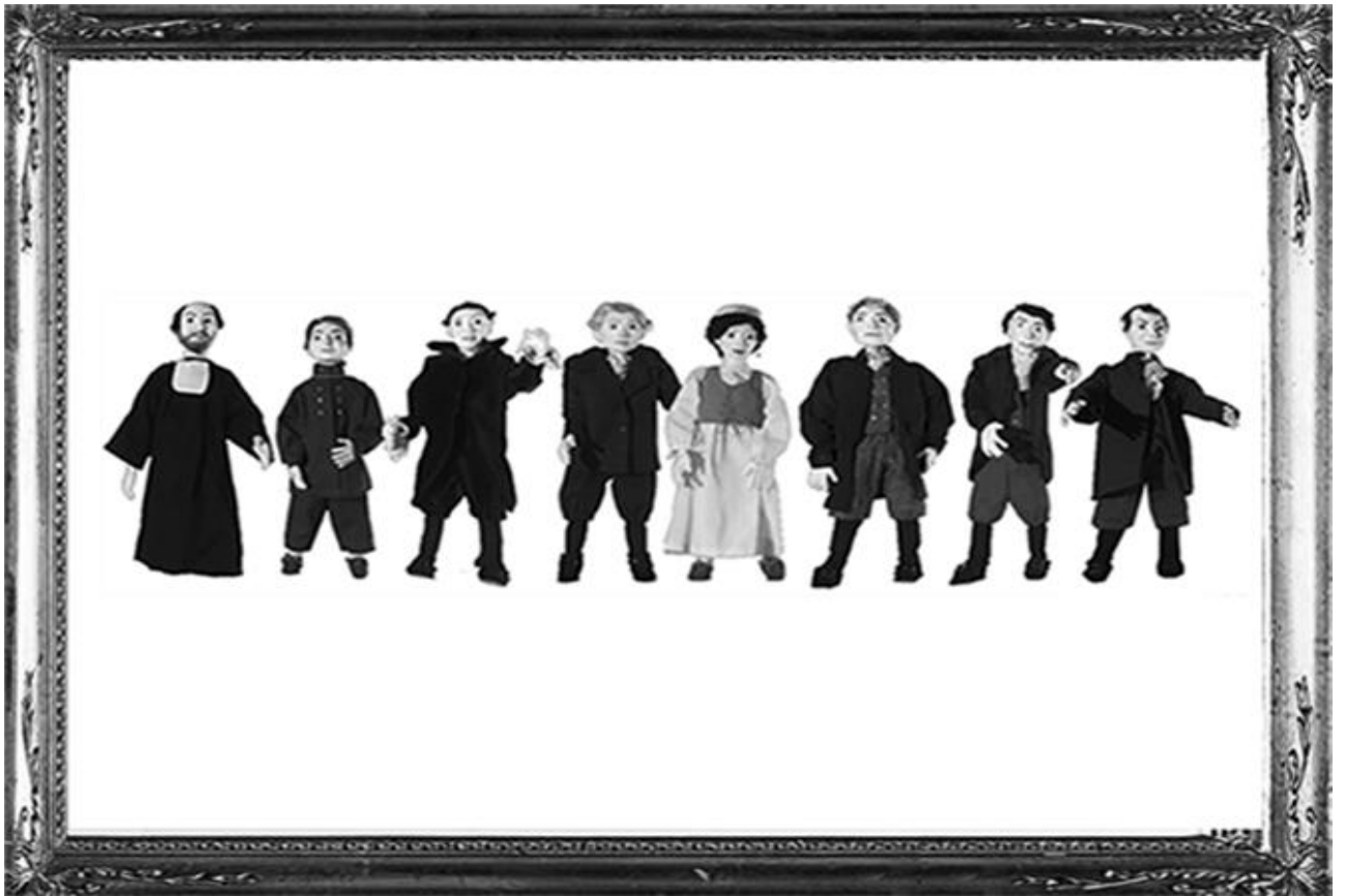
Figura 4 - Personagens utilizados nas sequências em stop motion

Os personagens eram compostos por um esqueleto metálico revestido de espuma e usavam figurinos criados a partir da pesquisa sobre o vestuário europeu do século XVIII.