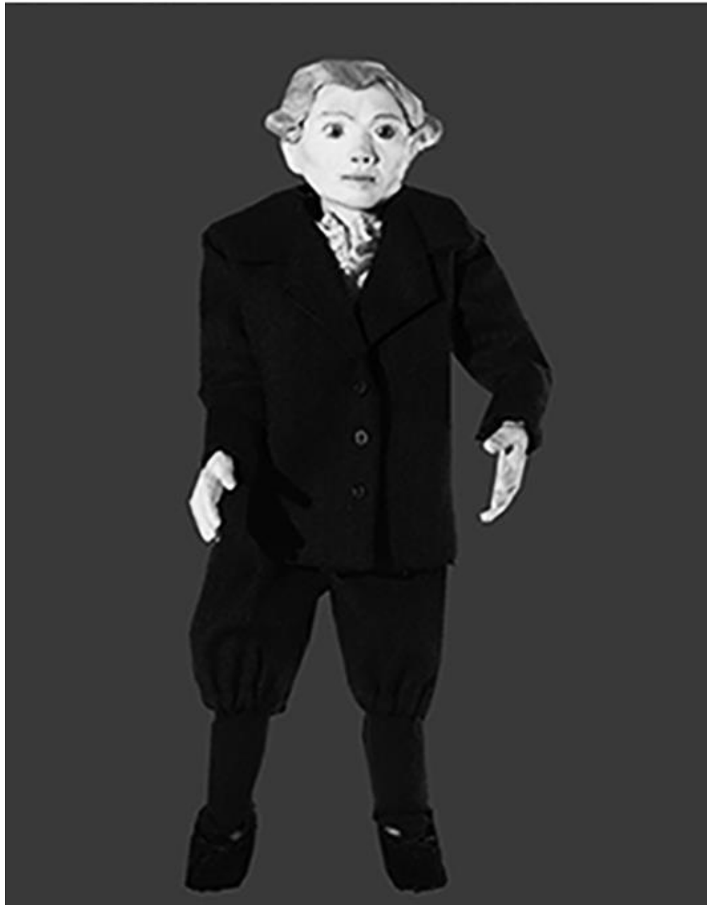
Figura 3 - Personagem Lichtenberg

Alguns dos personagens, como Lichtenberg (Figura 3) e o ator inglês David Garrick, por exemplo, tiveram suas feições originais reproduzidas nos pequenos rostos modelados para ser usados nas filmagens em stop motion .